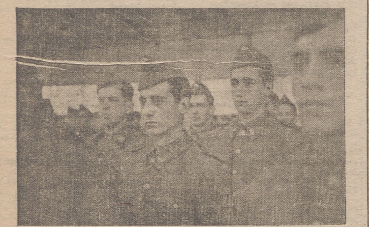
El aeródromo logroñés, así como un orgullo lo considera nuestra capital, pese a hallarse emplazado a algunos kilómetros de ella.