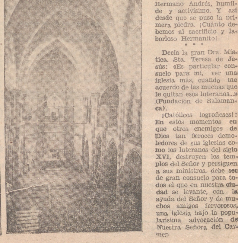
Decía la gran Dra. Mística. Sta. Teresa de Jesús: «Es particular consuelo para mí, ver una iglesia más, cuando me acuerdo de las muchas que le quitan esos luteranos.» (Fundación de Salamanca.) ¡Católicos logroñeses! En estos momentos en que otros enemigos de Dios tan feroces demolidores de sus iglesias como los luteranos del siglo XVI, destruyeron los templos del Señor y persigieron a sus ministros, debe ser de gran consuelo para todos el que en nuestra ciudad se levante, con la ayuda del Señor y de muchos amigos fervorosos, una iglesia bajo la populárista advocación de Nuestra Señora del Carmen.