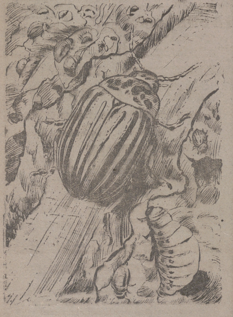
ESCARABAJO DE LA PATATA

«GESAFID» Este nuevo producto superconcentrado, abre un amplio horizonte a la lucha racional y económica contra las plagas de importancia primordial en nuestra agricultura.