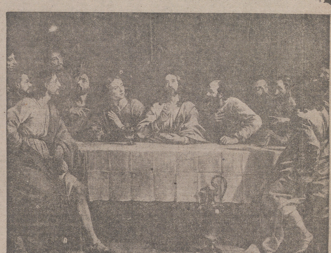
Añoche en la Judea; acaso por alguna ventana entreabierta de la estancia penetra la brisa alborotando las zizos grises de Jesús, varones como sus facciones, no con el afeminamiento que tantas veces le atribuye al arte (?) acomodado a una sensiblera beatería.

En el aire se masca la solemnidad de los apóstoles; quizás los apóstoles la lean en el rostro de Cristo.