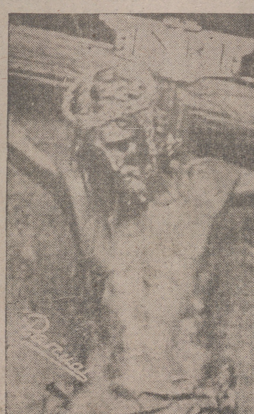
El Santo Cristo de las Anhas, de la iglesia de Palacio, que sale con la procesión del Viernes Santo.