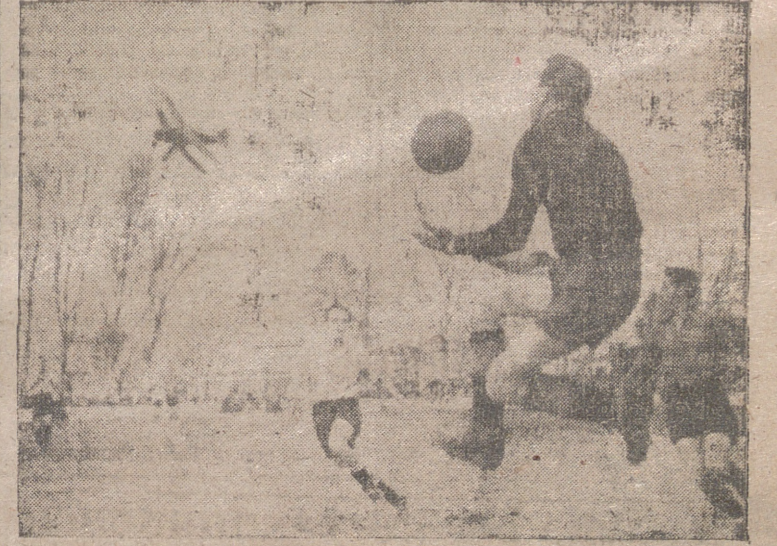
El portero del Mirandés detiene un balón que parece enviado desde el aire. (Foto y grabado Cortés Fayé).