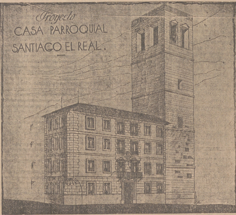
Proyecto CASA PARROQUIAL SANTIAGO EL REAL.

Casa de los y de las jóvenes, también para que el adolescente, cuando empieza a hombrar, no se despegue de un adulto cercano a la Madre Parroquia. Es necesario un