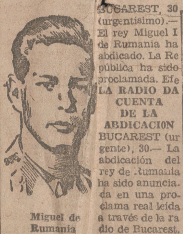
Miguel de Rumania

Se estima que la han provocado los comunistas para la completa sovietaización del país