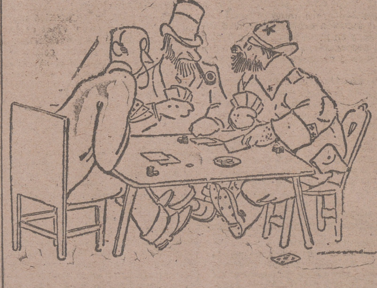
—Mire, amigo Rusoff, aquí se juega limpio, sin faroles ni trampas, ¿estamos?