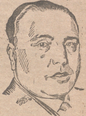
DON EDUARDO AUNÓS

CORDOBA.—El edificio del Tribunal Tutelar de Menores y Casa de Observatorio, construido en el barrio de la Fuensanta, ha sido inaugurado esta mañana bajo la presidencia del ministro de Justicia.