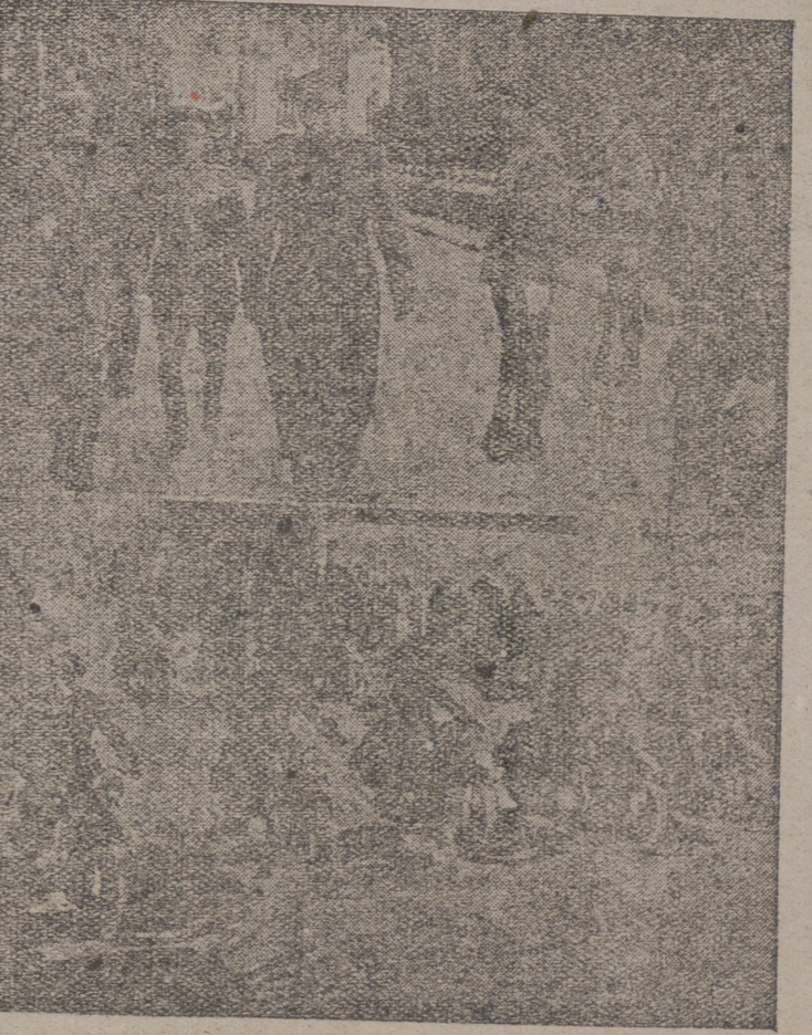
Actuación religiosa en el templo de San Juan de la Guardia, patrono de los Cuerpos Generales de Policía y Policía Armada y de Tráfico, así como la Guardia municipal, honraron a su excelso Patrono con diversos actos

Terminados los actos religiosos, en el momento de haber en esta—añadido—posiciones intermedias. El presidente Roosevelt terminó diciendo que hace 35 años, los combatientes norteamericanos fueron defraudados. No podemos defraudarlos de nuevo. La Conferencia de Crímes ha sido un esfuerzo eficaz hecho por los tres principales aliados para hallar un terreno común para la paz. Significa el fin del sistema de acción unilateral, alianzas exclusivas y esferas de influencia y balances de poder y todos los demás expedientes que han sido ensayados durante siglos y que fracasaron. Nos proponemos sustituir todo esto por una organización universal, en la que todas las naciones amantes de la paz puedan encontrar ocasión de unirse. Confío en que el Congreso y el pueblo norteamericano aceptarán los resultados de esta Conferencia como el comienzo de la estructura permanente de paz, sobre la que podemos empezar a construir, con la ayuda de Dios, esta mundo mejor, en el cual nuestros hijos y nietos—los vuestros y los míos y los hijos y nietos de todo el mundo—puedan vivir.—(Efe.)