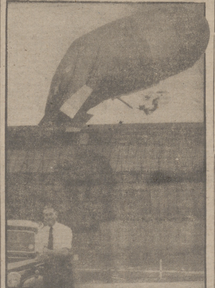
El dirigible "Bournemouth", en su segundo vuelo desde la estación de la R. A. F. en Cardington, perdió altura y acabó precipitándose contra el suelo. La causa inmediata del accidente fue el haberse enganchado la cuerda de aterrizaje de la aeronave con la parte alta de un edificio. En la foto, el "Bournemouth", con la barquilla destrozada, y de la cual salieron sin daño alguno los tripulantes de la aeronave.