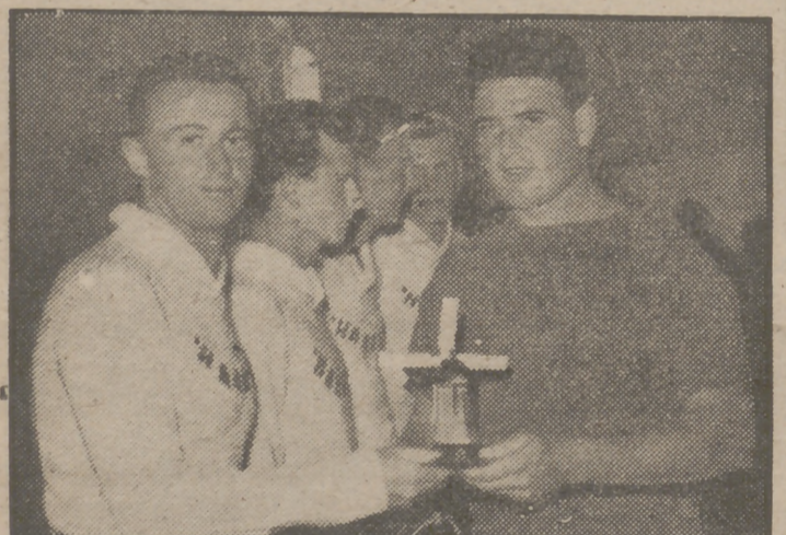
El capitán del Club Natación Barcelona, brillante triunfador del torneo internacional de natación y polo acuático celebrado en la piscina de Montjuich, recibe de manos del capitán del A. C. Haarlem, de Holanda, la reproducción en miniatura de un molino holandés, en la ceremonia del cambio de banderines.