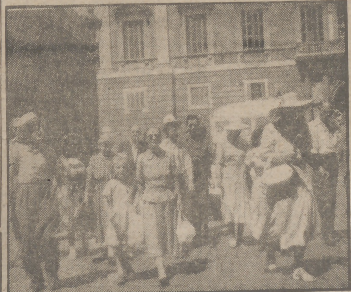
Grupo de turistas ingleses paseando por la ciudad, a cuyo puerto han llegado a bordo del trasatlántico "Orcades", en el que hacen una jira voranlega.