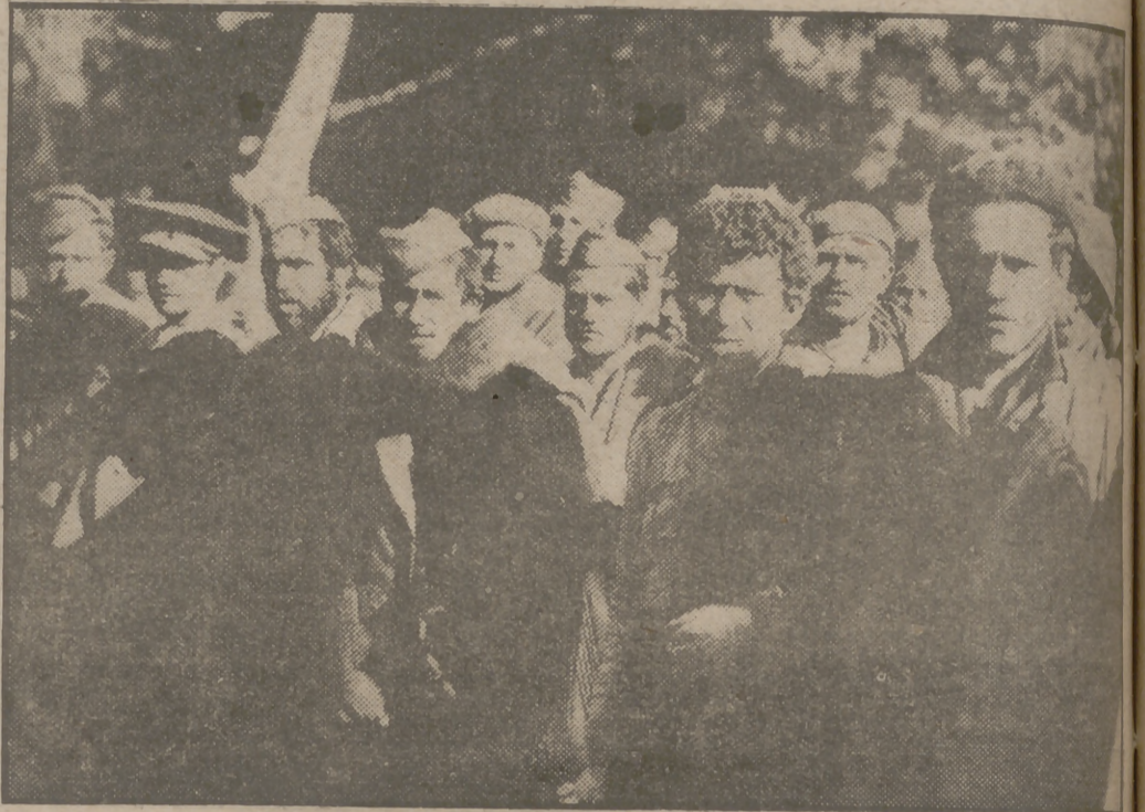
Combatientes españoles son conducidos a Francia e internados en el campo de concentración de El Perthus.

El guardián aquel, que al parecer no debe saber leer, coge la carta con el sobre al revés, le da una vuelta como buscando el sello o membrete del Comité de Coordinación, y no viéndolo nos ordena con la desconfianza retratada en el rostro que nos esperemos unos instantes mientras se pierde en el interior de un pasillo que seguramente da al despacho de Marty. En tanto, el ex boxeador nos contempla con ojos bovinos y una expresión tal de brutalidad que no cabe negar que el hombre tiene el cerebro abotargado por los golpes, y resulta poco menos que un niño en cuanto a capacidad mental. En la cadera derecha, por debajo de la chaqueta se le nota un bulto considerable, lo que quiere decir que va armado en debida forma. Para matar los minutos de espera, Corbinos intenta entrar en conversación con este "guardaespalaldas", al que comienza preguntándole si ha estado en España. Aquella especie de gigante, en principio, mira a Corbinos como no entendiendo la pregunta, y cuando éste se la repite después de un minuto de silencio, empleado en contemplarnos y convenirnos de que no somos espías ni agentes franquistas se levanta la chaqueta y nos muestra una respetable "Parabellum"