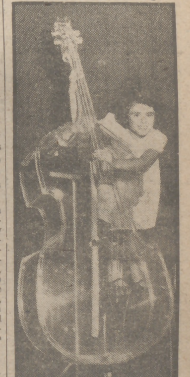
He aquí uno de los mayores instrumentos de cuerda construidos en el mundo. Esta gran pieza, de material plástico, totalmente transparente, ha sido expuesta en el Central Palace de Nueva York.