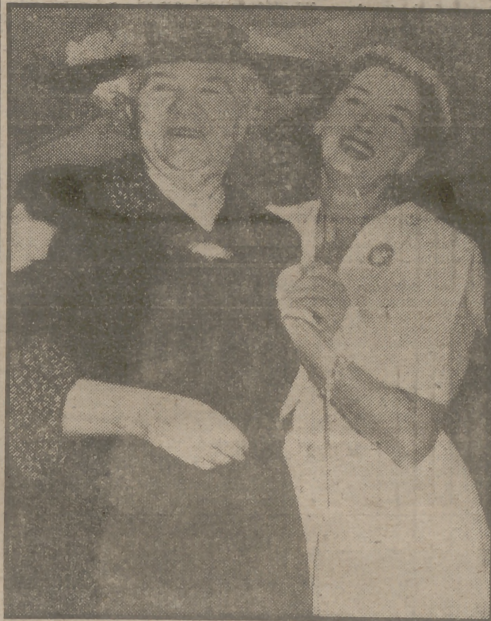
LA "HERMANA KENNY", CAMINO DE LA CONFERENCIA DE PARALISIS INFANTIL EN COPENHAGUE.—LA ENFERMERA AUSTRALIANA, ANGEL TUTELAR DE LAS VICTIMAS DE LA "POLIO", LA SUFRE ELLA MISMA