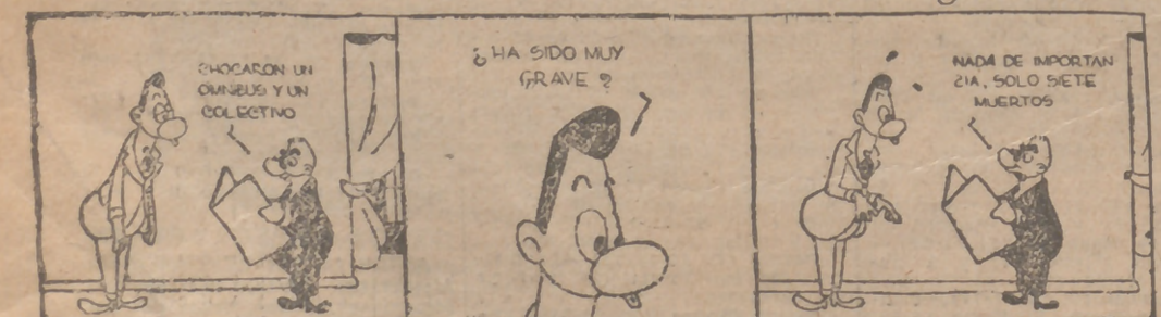
(De "Crítica", de Buenos Aires.)

TODOS LOS JUEVES "P A N" por RADIO NACIONAL, a las 9