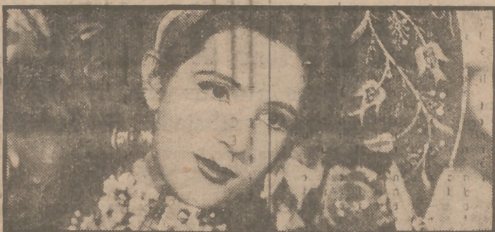
Sofía Alvarez, una de las más bellas actrices del cine azteca, es protagonista, junto al famoso cantor Pedro Infante, de "Soy Charro de Rancho Grande", film musical de próximo estreno en Madrid, presentado por Hispano Mexicana Films.