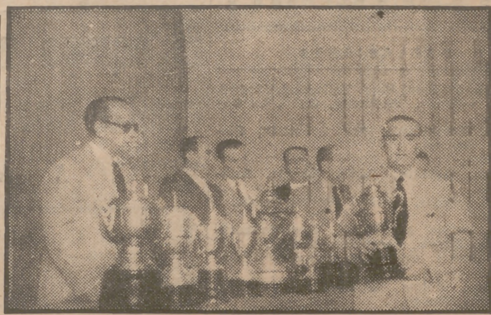
Don Manuel Valdés, presidente de la Federación Española de Fútbol, que ayer hizo entrega de las recompensas regionales de 1950-51 a los Clubs modestos madrileños.

El presidente de la Federación Española, don Manuel Valdés, expresó en unas breves palabras su satisfacción por este acto, de los más gratos y sencillos que ha asistido desde que está al frente del fútbol español, considerando como una meta de sus propósitos el apoyo a