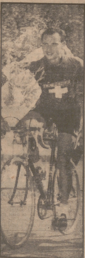
Koblet, vencedor ayer

1. ¡Qué desastre! Serían las cinco de la tarde del sábado cuando ocurrió. Estábamos emocionados mis amigos y yo viendo, a través de la pantalla de televisión, la escapada de Bernardo Ruiz Serra y Langarica. Les habíamos seguido en la escalada del Dyane, en la que fuimos al copo (en aquel momento fué nuestra primera copa). Continuamos con el oriolano y el vizcaino en lo alto del segundo col. Marchamos "al lado" de Bernardo en la tercera cima y volábamos con la gran figura del "Tour" camino de Brive... que yo no sabía que en francés se llama así a la gloria. Bernardo Ruiz—¡pero qué feo estaba, Dios mío, en aquel esfuerzo superhumano que realizaba!—era el vencedor. Y lo fué. Cruzó la meta entre las ovaciones y clamores de todos. Y... ¡qué desastre!