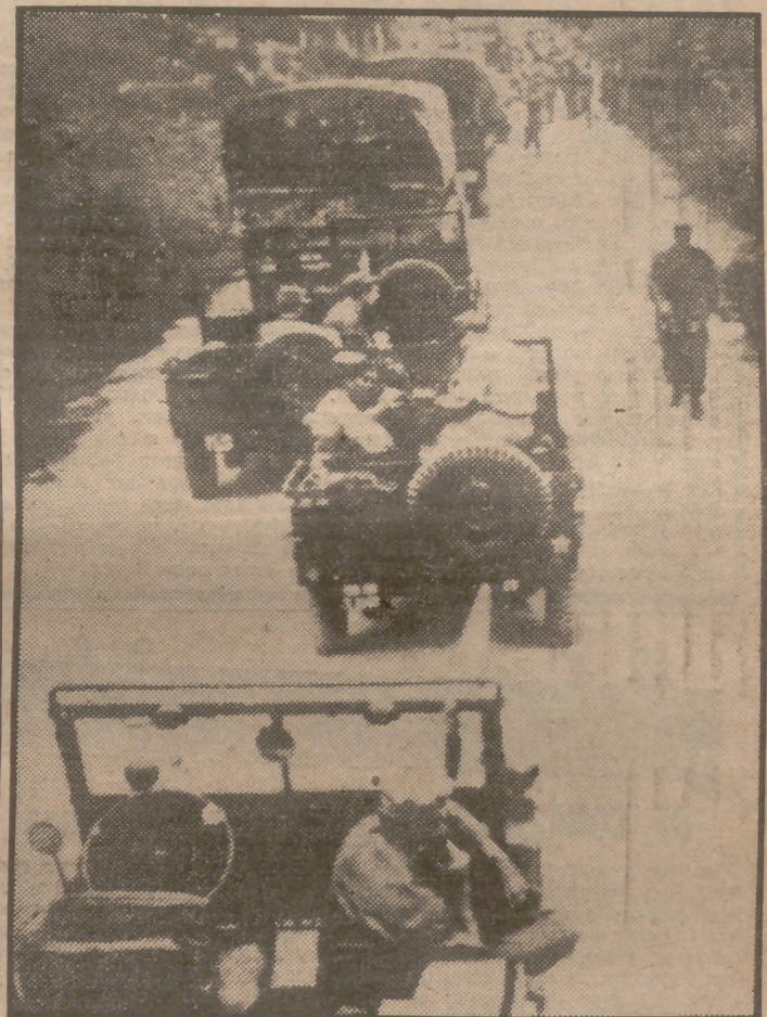
Este es el convoy de "jeeps" y camiones en el que marchaban a Kaesong los elementos de las Naciones Unidas, incluidos veinte periodistas, y que fué detenido por los comunistas precisamente por no querer admitir a reporteros y fotógrafos en la sede de la Conferencia del armisticio. Posteriormente, los rojos aceptaron las condiciones impuestas por Ridgway y ya ayer, domingo, y hoy, lunes, han pasado los convoyes, con periodistas y todo.

Las conferencias de Kaesong han sido reanudadas después de haberse opuesto el general Ridgway a que en Kaesong hubiera nortcoreanos armados. En la foto, que fué tomada el primer día en que los fotógrafos occidentales fueron admitidos a la escena de las conversaciones, vemos a los nortcoreanos armados, de espaldas al edificio de Kaesong en que se celebran las conferencias del armisticio.