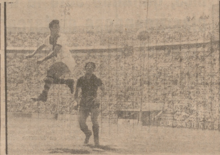
Una espectacular jugada de fútbol, el apasionante deporte que entusiasma a las multitudes.

Y los griegos piden para sí la paternidad del fútbol, basándose en el "episcuros", que citaba ya Smith en su "Diccionario de antigüedades". Para otros la razón del derecho-descansa en la práctica probada del "sphoeris machis", sin que nos sea posible pronunciarnos en