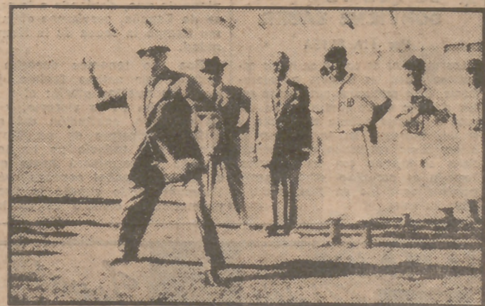
En el Estadio Metropolitano se ha jugado el encuentro de pelota base entre el equipo norteamericano Rhein Main Rockets y una selección de Castilla, que fué ganado por los primeros (7-1). En el grabado, el embajador de los Estados Unidos, Mr. Stanton Griffiths, hace el saque de honor, en presencia del ministro del Aire, teniente general Gallarza. (Información en páginas interiores.)

Un equipo americano venció a la selección castellana