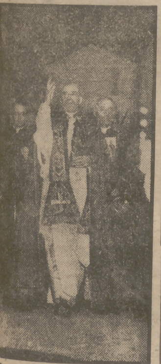
Su Santidad Pío XII inauguró y bendijo el pasado día 2, festividad de San Eugenio, patronímico del Papa antes de ser elevado al solio pontificio, la nueva Iglesia que lleva su nombre. Vemos aquí al Padre Santo en dicha ceremonia, acompañado de los guardias nobles.

A las diez en punto, el Generalísimo y su séquito llegaban al pueblo de Villa del Río. Toda la población en masa se hallaba congregada para recibir al Caudillo, y a su llegada prorrumpló en gritos de "¡Franco! ¡Franco! ¡Franco! ¡Arriba España!" Seguidamente, la comitiva continuó su marcha hacia esta capital, y a su paso por Montoro, El Carpio y Alcolea el Generalísimo fue objeto de muestras de adhesión inquebrantable por el vecindario que se agolpaba para presenciar su paso.