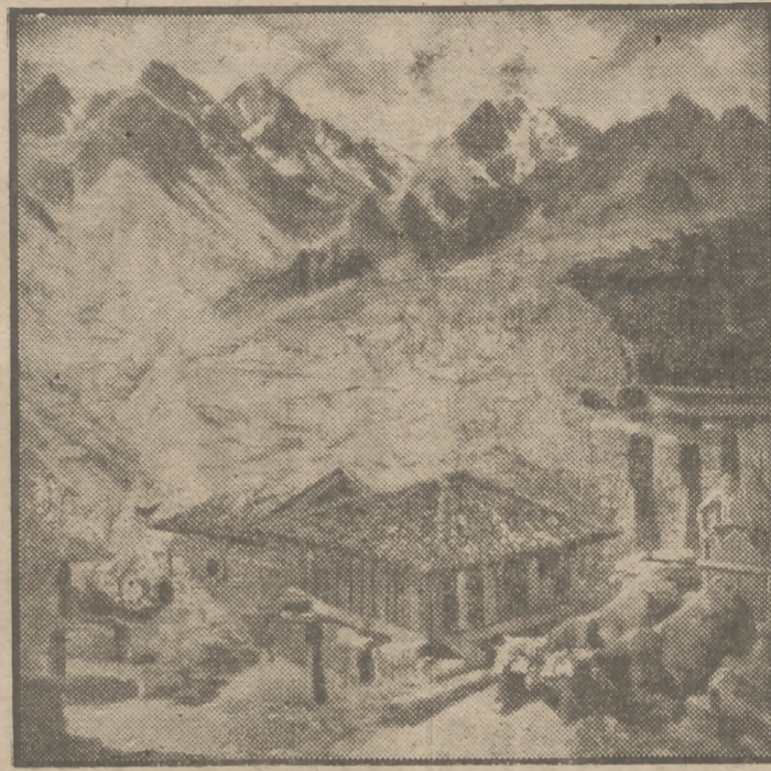
"Viejos hórreos" (León), por José Manaut.