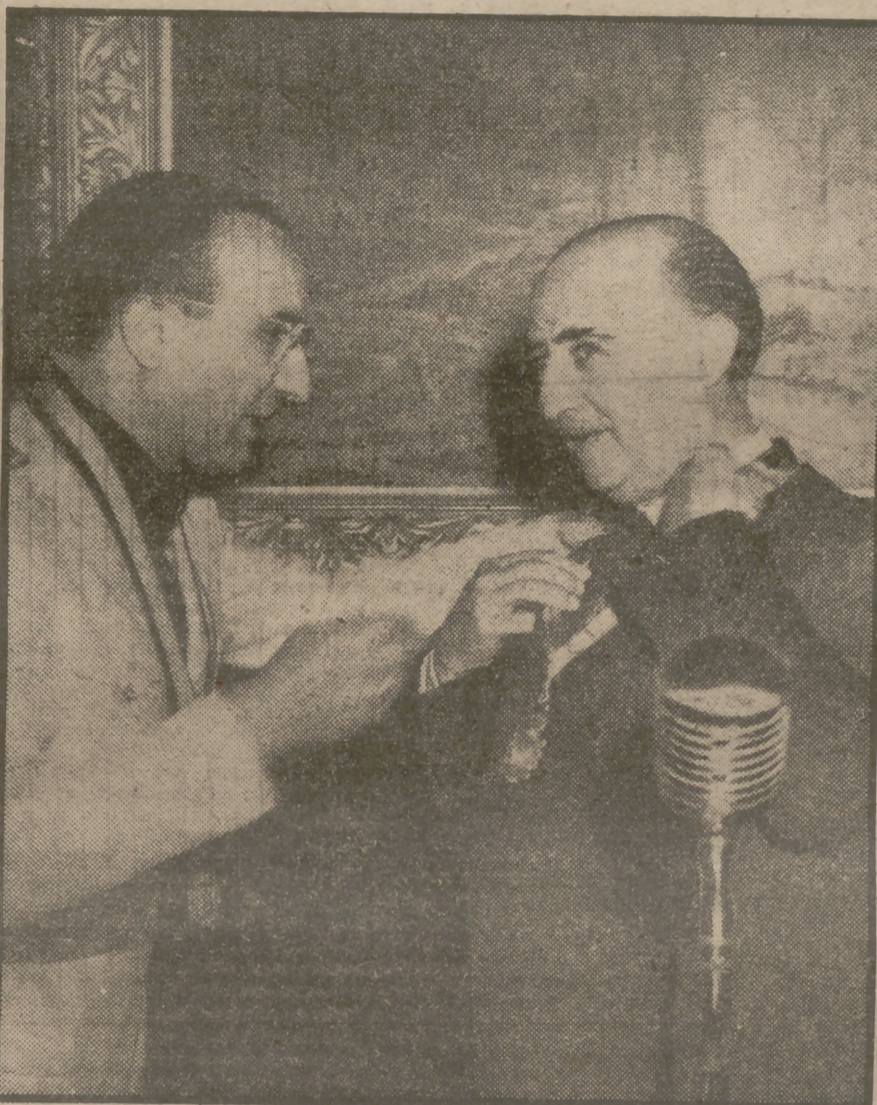
El Caudillo ha recorrido las tierras jiennenses para conocer personalmente los problemas que afectan a dicha región. A su paso por los pueblos de la provincia, como durante su estancia en Jaén, el pueblo ha expresado a Su Excelecia el jefe del Estado su emocionada adhesión y su gratitud al estadista insigne que establece contacto personal con las multitudes trabajadoras. Vemos aquí al alcalde de Baosza imponiendo la Medalla de la Ciudad al Generalísimo Franco. Las últimas noticias de este viaje triunfal dan cuenta de la estancia de Franco en Córdoba.