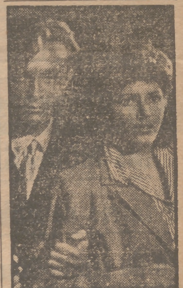
Carla del Poggio y Jacques Fernas en una escena de "Juventud perdida", obra maestra de la cinematografía moderna, que ha presentado Edici en el aristocrático cine Capitol, con gran éxito de crítica y de público.