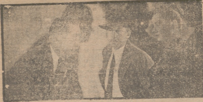
Andrey Totter, Lloyd Nolan y Robert Montgomery en una escena de "La dama del lago", la innovación más sensacional en la historia del cine, verdadera superproducción de la M. G. M., que hoy, viernes, se estrena en el Palacio de la Música