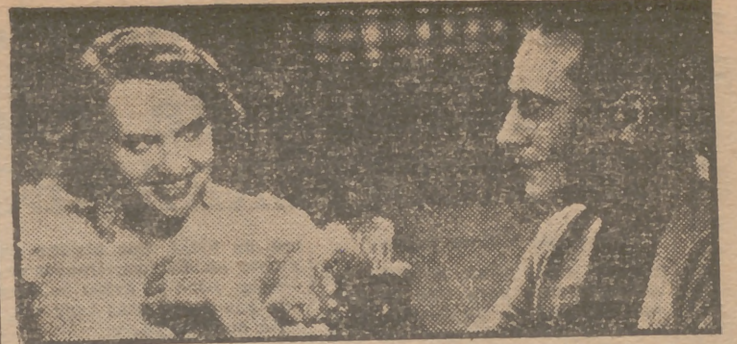
Madeleine Sologne y el popular cantor Tino Rossi en un primer plano del film de gran éxito "Fiebre en el alma", que Edici presentará en breve en la pantalla del suntuoso cine Rex.

Esta película ha sido patrocinada por el Círculo de Escritores Cinematográficos