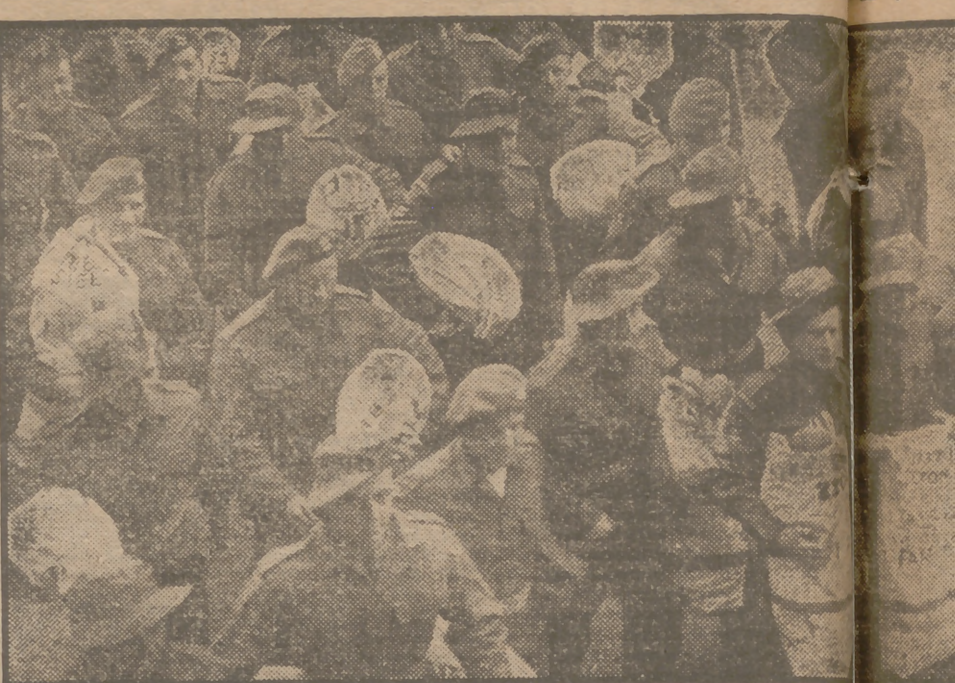
Soldados británicos del regimiento Leicestershire, equipados con uniformes tropicales, se dirigen al barco que los conducirá a Hong-Kong, donde van a reforzar la guarnición establecida.