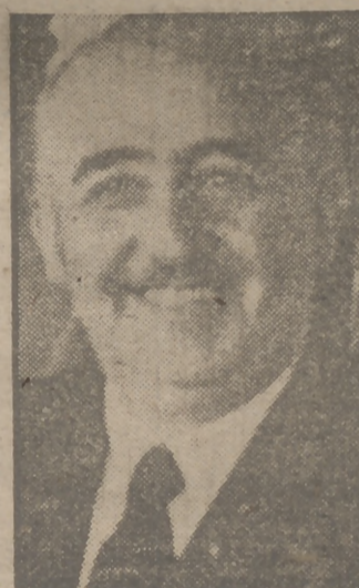
acuerdo separado entre España y los Estados Unidos para fortalecer la seguridad de Europa Occidental y zona mediterránea?