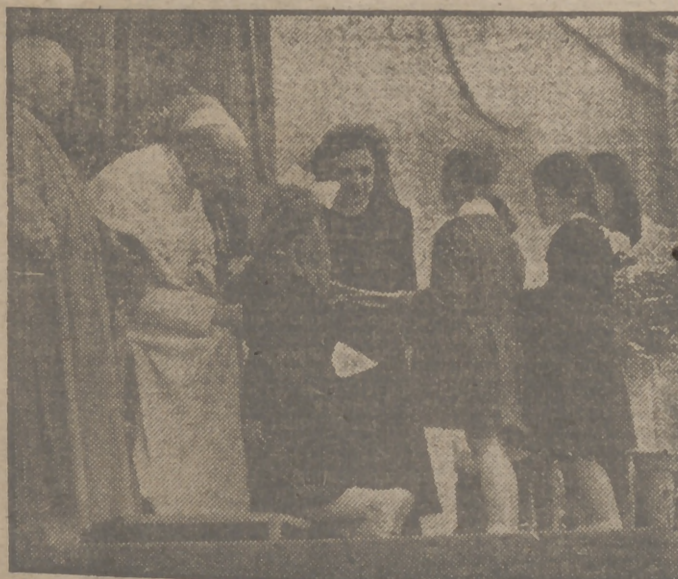
Cincuenta mil niños romanos se concentraron en el Belvedere del Vaticano el día 1 de este mes, para rendir homenaje a Su Santidad el Papa Pío XII, con motivo de las bodas de oro de Su Santidad con el sacerdocio.