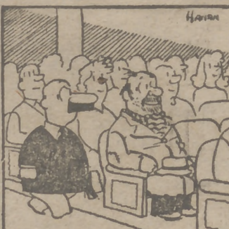
Uno de los más destacados humoristas británicos es, indudablemente, Harry Hanan, que en las columnas del "Daily Mail" londinense ha popularizado la figura de "Lonie", del que hoy ofrecemos a nuestros lectores una de sus graciosas aventuras.