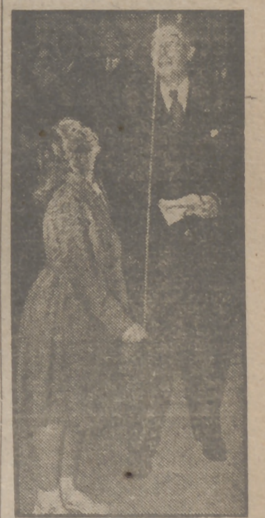
La princesa Beatrix, una de las hijas de la Reina Juliana de Holanda, en el momento de la inauguración en Utrecht de la Feria Industrial holandesa. Acompañaban a la princesa su madre y su hermana la princesa Irene. Este es el primer acto oficial al que asiste la princesa holandesa.