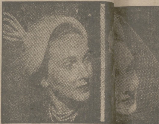
En una Exposición de modelos primavera de Londres, llamaron poderosamente la atención del público que harán furor esta primavera. El modelo de color rojo adornado con rosas naturales, vale lo mismo, modelo adornado de avestruz.