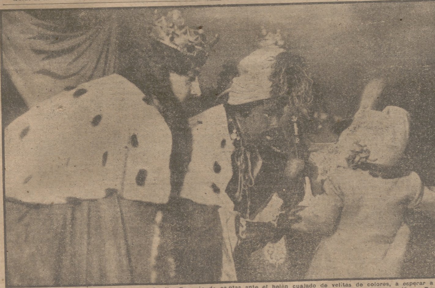
Es la racha de la gloria, del embeleso infantil... Después de cantar ante el bolón cuajado de velitas de colores, a esperar a la realeza mágica. Gaspar, Melchor y Baltasar... Sueñan con ellos, con sus frágiles y brillantes tesoros todos los niños... Desde el que balbucea hasta el que carraspea... He ahí una niña pasmada frente a las figuras reales que le ofrecen toda clase de regalos... Con el tiempo, con el mal tiempo, ha quebrado la tradicional amenaza. El niño "malo" sonríe y guiña el ojo: "¡Mira que si me ponen carbón! Menudo negocio!"