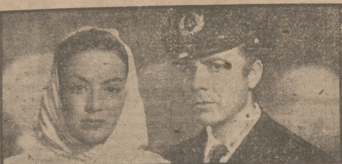
Con el mayor de los éxitos de público sigue en la cartelera del Avenida la magnífica película "Mare Nostrum". Reproducimos un primer plano de María Félix y Fernando Rey, pareja central de "Mare Nostrum".