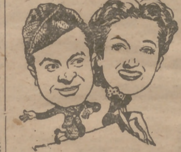
Dorothy Lamour y Bob Hope, pareja central de la divertida superproducción de la Paramount "El recluta enamorado", que Mercurio Films presentará muy pronto en la pantalla madrileña.