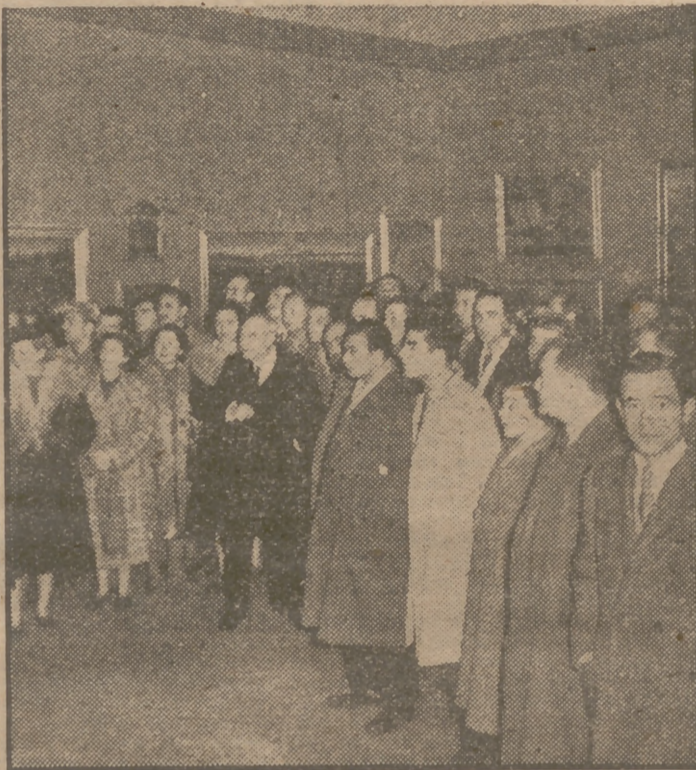
Los universitarios italianos que ayer fueron recibidos por el secretario general del Movimiento, don Raimundo Fernández Cuesta—entrevista que transcurrió dentro de la mayor cordialidad—han visitado esta mañana el Museo del Prado, de cuyo tesoro pictórico hicieron grandes alabanzas, y algunas de las dependencias del Instituto de Investigaciones Científicas, acompañados en una y otra visita por las autoridades competentes, que les dieron las oportunas explicaciones.