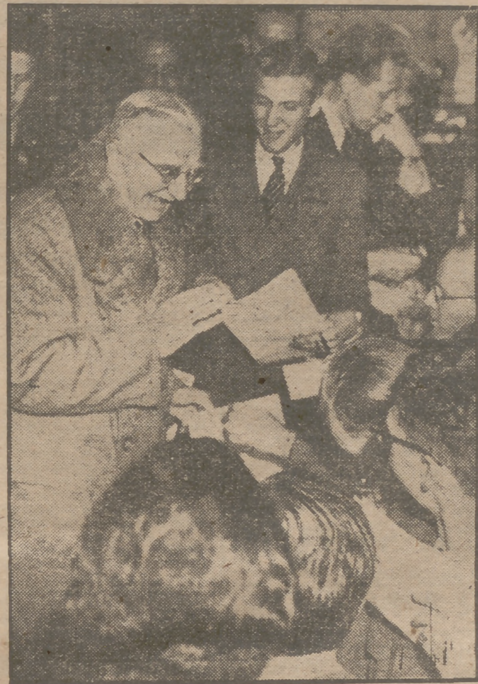
El doctor Schacht, absuelto en Nuremberg, firmó múltiples autógrafos a su salida de la prisión. Previamente había convenido el premio: una onza de chocolate a cambio de estampar su firma y rúbrica en los álbumes de los coleccionistas.

Pero lo cierto es que Schacht continuó colaborando con los nazis sin ser molestado ni reclamado por la Gestapo, aunque siempre tenía en la punta de la lengua su dimisión. Hitler no se avenía a prescindir de sus servicios. En el fondo reconocía que Schacht era el único hombre con que podía contar en materia de finanzas; materia en la que no destacaba ninguno de sus más allegados colaboradores. Goering, que sentía aversión hacia Schacht y hacía sus "métodos financieros", cuando entró en el modesto gabinete de trabajo de aquí para sucederle al frente del Ministerio de Finanzas, exclamó así escandalizado: "¿Cómo se pueden tener elevados pensamientos en este cuclitril!" Si el resultado de la disputa en Obersalzberg fué la destitución de Schacht como ministro de Finanzas del III Reich, la siguiente entrevista que había de celebrar con Hitler iba a costarle la presidencia del Reichbank. "Me fué ordenado, por teléfono, a las doce de la noche, que me presentase a las nueve