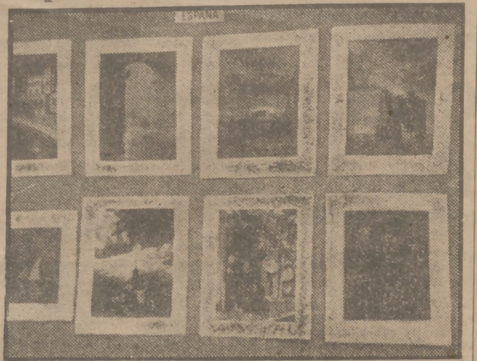
Algunas de las obras que figuran en la Exposición de fotografías inaugurada ayer en Bellas Artes, a la que han concurrido numerosas naciones extranjeras.