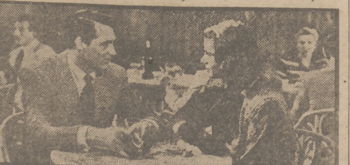
Ingrid Bergman y Cary Grant en una escena de la soberbia realización de Alfred Hitchcock "Encadenados", que con el mayor de los éxitos ha entrado en su tercera semana de proyección en los cines Paz y Calatravas.

— Busca la mujer — dijo Stromberg — y encontró a Hedy Lamarr, monumento de belleza y elegancia, ya que la insignia estrella luce en esta cinta cuarenta magníficos modelos.