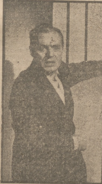
Charles Boyer en un primer plano de la superproducción de Universal Films "Venganza de mujer", film que muy pronto se estrenará en Madrid.