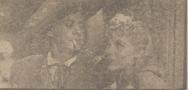
Blanca de Castejón y el graciosísimo caricato argentino Luis Sandrini en una graciosa escena del jocoso film "Yo soy tu padre", que Hispamex presentará en breve al público madrileño.