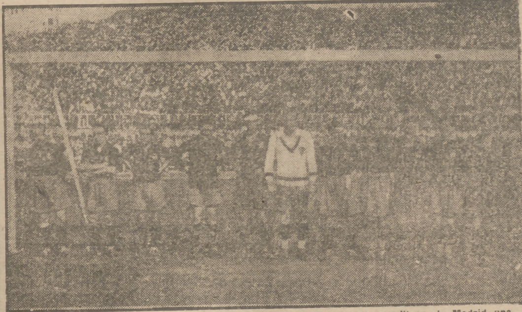
El equipo de España que en el año 1929 lograba en el Estadio Metropolitano de Madrid una resonante victoria sobre el potente conjunto representativo del fútbol inglés.