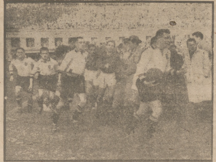
Los dos conjuntos saltan al terreno de juego.

El doctor Cabot termina de vender la pierna de Aparicio, el gran defensa lesionado gravemente en los últimos minutos del partido. Aparicio debe sufrir mucho por el desgarrar que padece, pero se le ve que aun más por la jugada desgraciada que ocasionó el gol de Bélgica y de la que fué protagonista. Por eso nos resistimos a interrogarle. Pero el montañés, comprensivo, nos facilita el mismo los detalles que necesitábamos: —Yo llevaba el balón sintiendo que era perseguido, pero, además, oí a Zamora que me decía: —¡Suéltala ya suéltala!