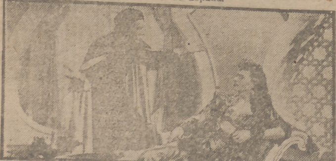
Maureen O'Hara y Douglas Fairbanks en una escena del espectacular film "El marino", que se proyecta con gran éxito de público en el cine Coliseum.