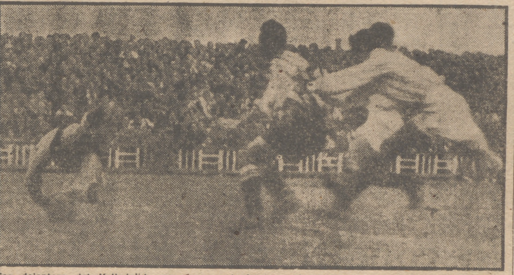
Ese delantero del Valladolid que vemos en la foto no cabe duda que está "presionando" sobre la defensa del Atlético. Vean cómo sus manos empujan firmes en el tórax de Lozano. Mientras tanto Domingo se ha lanzado a recoger el disparo, y su estirada será suficiente para atajar el peligro. Después el Valladolid seguirá "presionando".