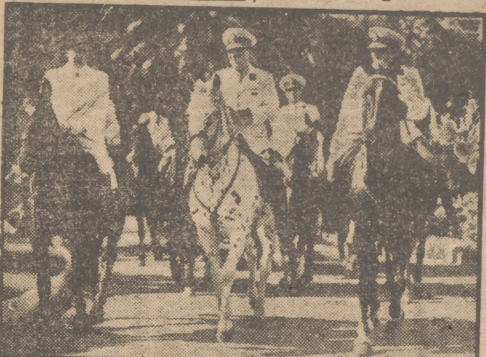
Organizada por el Club Hípico Argentino, se celebra una magnífica fiesta, a la que asiste el Presidente de la República, general Perón, consistente en seguir y capturar a una de las personas que hacen las voces de "El Zorro". Esta brillante fiesta ha sido seguida con el máximo interés por la afición hípica argentina, que, como es sabido, es una de las más entendidas del mundo. Ved aquí al Jefe del Estado argentino, general Perón, jinete en su soberbio alazán.

Marshall envía una severa nota de censura al secretario Forrester