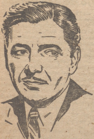
Ronald Colman, protagonista de "Doble vida". Por su brillante interpretación en este excepcional film fue premiado con el preciado Oscar de la Academia de Artes y Ciencias Cinematográficas de Hollywood.