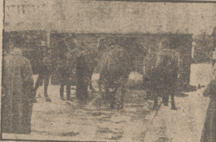
Una partida de caballos holandeses, con destino al Ejército español, a su llegada a la frontera, son cambiados de vagones.