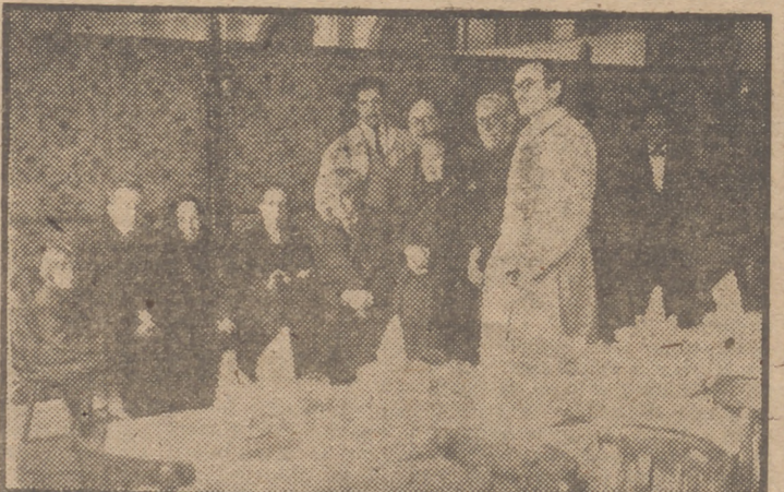
Un momento del homenaje ofrecido por los vendedores de Prensa a su Junta rectora, y al cual asistieron, especialmente invitados, veintidós ancianos jubilados del gremio.