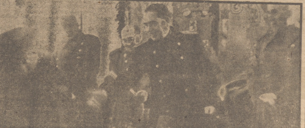
Esta mañana se ha verificado la entrega, en la Escuela Politécnica, de los despachos a los nuevos ingenieros de armamento y construcción. Vistos aquí en la presidencia del acto a los ministros del Ejército, Marina y Obras Públicas