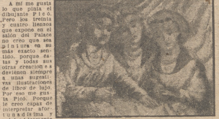
"Figura de niñas", de José Pico.

A mí me gusta lo que pinta el dibujante Pico. Pero los treinta y cuatro lienzos que expone en el salón del Palacio no creo que sea pintura en su más exacto sentido.