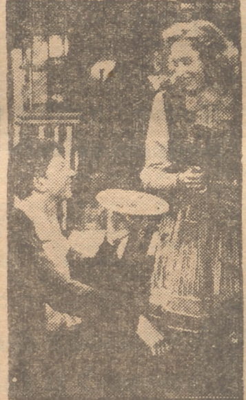
Susana Foster y Donald O'Connor en una escena del divertidísimo film musical "Triunfo la juventud", que Distribuidora Chamartín presentará el lunes próximo en la pantalla madrileña

Fred Mac Murray celebra ahora su décimo aniversario de actor de la pantalla y la cincuenta película en que ha intervenido con "El milagro de las