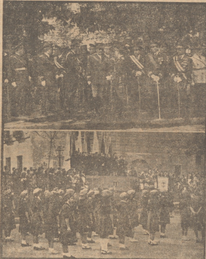
El Cuerpo de Intendencia y la Sección Femenina han celebrado hoy la festividad de Santa Teresa, su Patrona. Venimos aquí a los generales y jefes de la guarnición de Madrid que asistieron esta ma-

Y EL CUERPO DE INTENDENCIA CON UNA MISA EN EL TEMPLO NACIONAL