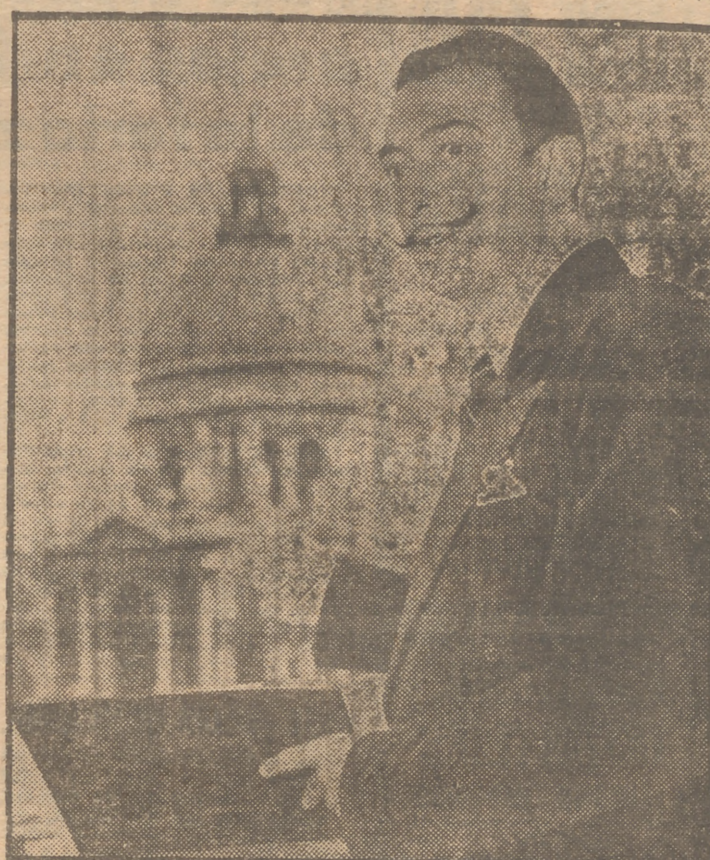
Salvador Dalí hojea su último atlas surrealista, apenas llegado de Nueva York. Se siente muy feliz por encontrarse en Venecia. La ventana de su habitación da al Gran Canal y enmarca la gran fachada barroca de la Iglesia de la Salud, que se ha convertido en su "modelo" preferido. No le gustan los vitrales que están a ambos lados de la entrada principal. Dice que le dan a la iglesia cierto aire de garaje.