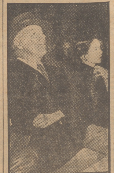
Charlie Chaplin y su esposa, Ona, asisten a un mitin y escuchan con perceptible atención un discurso de Henry Wallace sobre los méritos del "tercer partido". El discurso lo pronunció Wallace durante su campaña electoral en el Gilmore Stadium, de Los Angeles (California).

Igualado... rior emper... ro n... agiganta... toria de... es tan... la del p... tituye... tendido... nológico... vano se... es el tr... medieval... dad pres... a la His... mónico... de los... modo ad... maba el... espíritu... La espa... ténico... alguna... Angu... la lea... al... firmem... La esped... obliga... Cuesta... significa... filósofo... su obra... constituy... te, la "D... Tratado... ser consi... dadera... cho Natu... o civil... Destaca... de Suárez... colisión... privada... dal"—con... ralidad... particular... costumbres... en la dom... ta con... abrogar... civiles... granadino... mente, sí... cita de... aceptar".