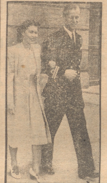
La princesa Isabel y el príncipe Felipe fotografiados en el palacio de Buckingham pocos días antes de su boda.

EL futuro "baby" de la princesa Isabel y del duque de Edimburgo será un "commoner", esto es, no de sangre real, ya que su padre no es duque de la realeza británica. El "baby", sin embargo, se encuentra en la línea directa de sucesión al Trono. Ese natalicio, así, evoca ciertas prácticas y costumbres que se han venido observando en la Casa Real de Inglaterra cada vez que nace un infante.