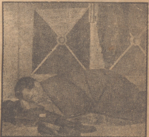
Garry Davis, el "primer ciudadano del mundo", se acuesta todas las noches a la puerta de la O. N. U.