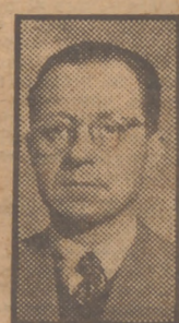
de entrevistas con directores de

El secreto del triunfo publicitario, prestigio de los artistas españoles