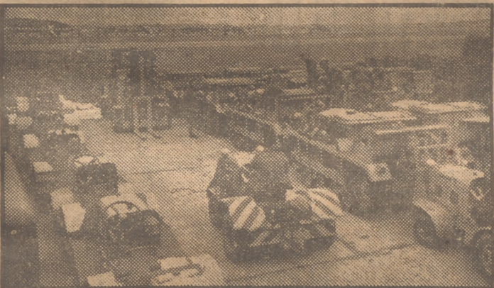
Fuerzas de Aviación de los Estados Unidos llegan en tractores con un equipo mecánico a la base de Burtonwood, en Washington (Lancashire). Es la primera base británica ocupada en la postguerra por fuerzas americanas.