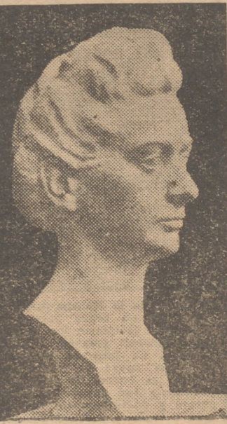
"Retrato", por Jacinto Higuera Catedra.

LAS esculturas enviadas a la Exposición Nacional de Bellas Artes se encuentran en el Palacio de Cristal y suman 93 obras, entre las que, como acertadamente observó Sánchez Camargo, abunda excesivamente el busto de encargo.