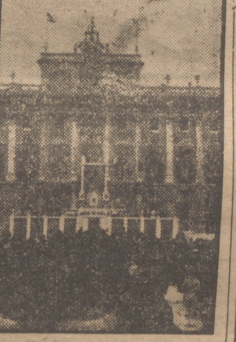
Grandioso altar levantado en la plaza de la Armería a la Virgen del Rosario, de Fátima,

La Adoración Nocturna Española—Sección de Madrid—comunica a los adoradores que deben con-