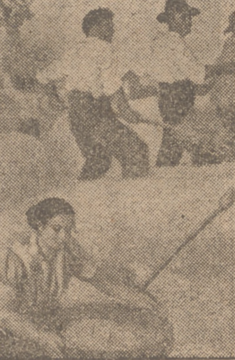
Una de las obras de Eugenio Hermoso en la Exposición Nacional de Bellas Artes.