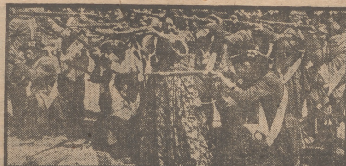
Reproducimos una escena de "La hija del capitán", la más grandiosa y espectacular realización del cine europeo. Encarnan los papeles estelares de esta soberbia película la bellísima Irasema Dillian y el conocido y aplaudido galán Amadeo Nazzari.