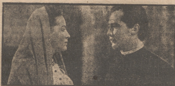
María Félix y Fernando Fernández en una escena de "Enamorada". Un magnífico escenario para una pasión arrolladora en la más fastuosa realización del cine mejicano de todos los tiempos. "Enamorada" es el primer film hispanoamericano declarado de interés nacional.

y envíelo relleno con toda claridad a la Dirección del cine donde ha sido estrenada la película por la que vota. Esta película ha de ser necesariamente de las estrenadas en Madrid desde el 1 al 31 de marzo inclusiva. Entre los votantes de la película que reúna mayor número de votos serán sorteados diversos regalos, entre los que figuran QUINIENTAS PESETAS para invertir en GALERIAS PRECIADOS y otras QUINIENTAS PESETAS en los ALMACENES SEPÚ.