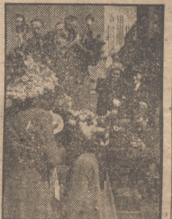
Numerosos fotógrafos de Nueva York captan estos originales sombreros, que no pecan por falta de adornos.