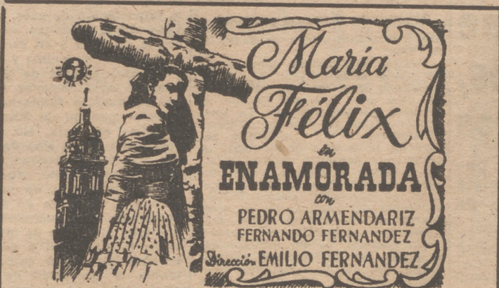
Sobre el fondo espectacular y viril de uno de los múltiples episodios de la revolución mejicana se levanta la historia de un amor apasionado.

"¿Qué bello es vivir!", Palacio de la Música (27-3). "La princesa y el pirata", Avenida (27-3). "Predilección", Callao (27-3). "Vivir en paz", Capitol (27-3). "Gunga Din", Coliseum (27-3). "El sol de Montecassino", Imperial (27-3). "Camino de Sacramento", Infantas (27-3). "El despertar", Palacio de la Prensa (27-3). "Aventuras de Buffalo Bill", Rex (27-3). "El ocaso de los mohicanos", Actualidades (27-3).