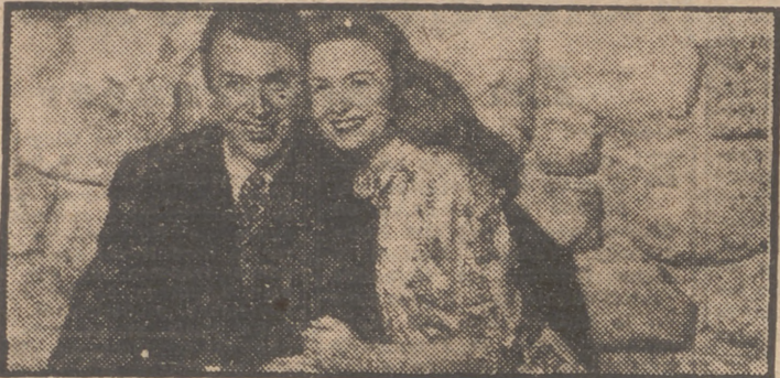
Donna Reed y James Stewart en una escena de "¿Qué bello es vivir!", genial realización de Frank Capra que con el mayor de los éxitos se proyecta en el Palacio de la Música.