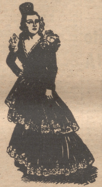
Imperio Argentina, primera figura del cine español, canta con su peculiar y único estilo las más bellas canciones del folklore hispanoamericano en "La cigarra", film de gran éxito que será presentado por Filmófono, S. A.

pirata", donde el buen humor corre pareja con la belleza de los escenarios, la no menos belleza de las "bellezas Glodwyn" y la música inspirada.