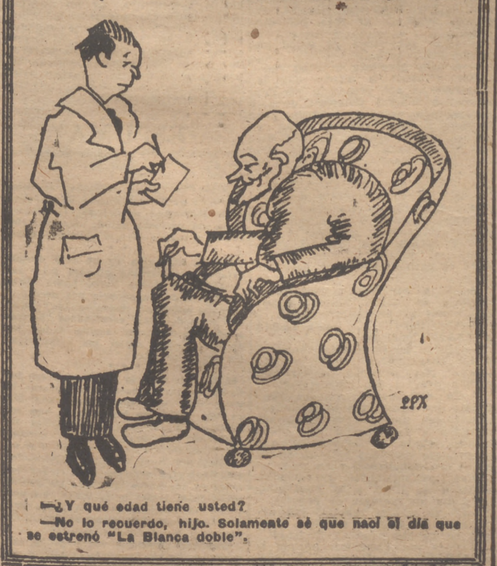
—¿Y qué edad tiene usted? —No lo recuerdo, hijo. Solamente sé que nació el día que se estrenó "La Blanca doble".

Vertical text on the left margin containing various small notices and advertisements.