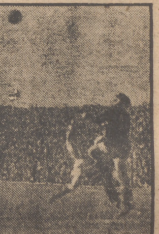
Galarraga en un buen despeje durante un aceso de la celeridad atlética.