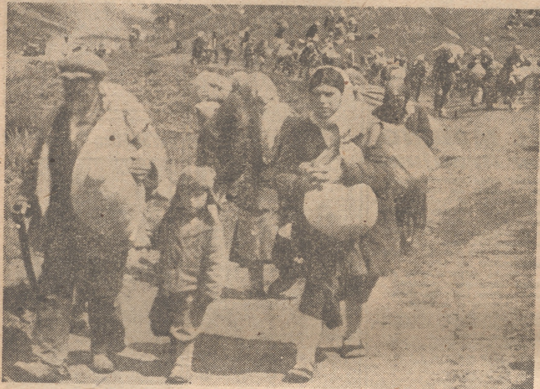
El pueblo trabajador de la mayor parte de Europa padece vicisitudes innumerables. El éxodo de naciones enteras, como en la foto, llena los pechos de angustia. En esta hora, España siente el espolique de la miseria ajena y tiende a perfeccionar su sistema social

NO tema el lector que ahora vengamos repitiendo los elogios que el Instituto Nacional de Previsión merece y recoge a diario por sus espléndidas obras sociales y humanas. Tampoco se nos ha ocurrido enumerarlas una vez más, ya que están en la memoria de todos y lo que todavía es mejor, prodigan sus beneficios sobre viejos, inválidos para el trabajo, familias numerosas... Ahora nos proponemos algo distinto, más sencillo, más desconocido y menos accesible a esta actualidad prodigiosa que crea sin cesar, transforma y substituye obras sociales. Impulsada por el afán humanismo de nuestro tiempo y por ese afán incontentable que nos posee a todos, cualesquiera que sean nuestra posición en la sociedad, nuestras convicciones políticas y nuestras creencias de otra índole.