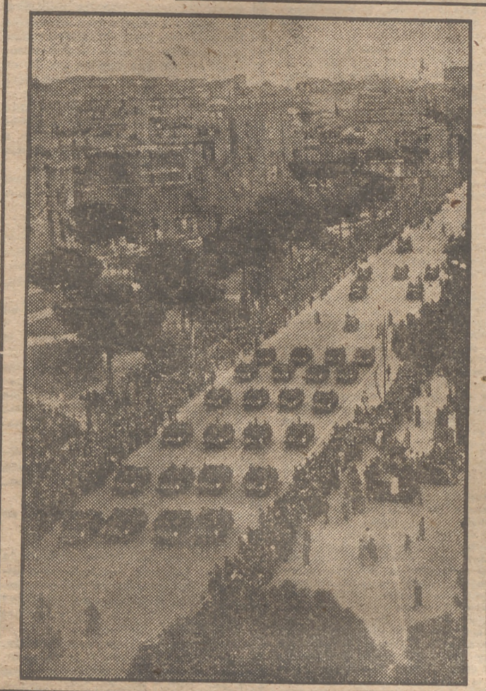
Das semanas antes del día señalado para las elecciones italianas los habitantes de Roma han contemplado un gran desfile de fuerzas militares por las calles principales de la Ciudad Eterna. El despliegue de elementos mecanizados y armas modernas ha sido impresionante. ¿Pero cabe preguntarse: ¿hacen falta tropas para unas elecciones democráticas? ¿Qué se los hubiese ocurrido decir de España a tantos "avisados" periodistas que escriben sin molestarse en visitarnos si unos días antes del referéndum que el 8 de julio de 1948 dió un triunfo absoluto en las urnas al régimen de Franco, hicimos alarde de desfiles como el que recoge la presente fotografía?

"Si las acusaciones contra RUSIA son veraces deberá actuarse rápidamente"