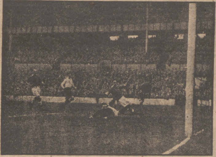
Len Duquemin (izquierda, camiseta blanca), delantero centro del Spurs, de diecisiete años, bate al portero del Millwall, Malcolm Finlayson (en tierra después de su infructuosa estirada), y marca así el primer gol para su equipo, que ganó el partido por 3 a 2.