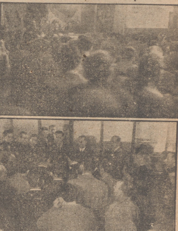
Durante su reciente viaje a Asturias, el Delegado Nacional de Sindicatos presidió varias importantes Asambleas y Juntas Sindicales en distintos pueblos de aquella provincia, como estas que recogen nuestros grabados en Sama de Langreo y Pola de Lébiana.