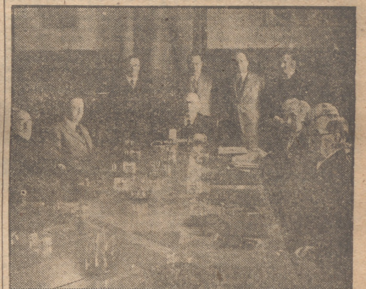
El ministro de Educación Nacional presidió esta mañana la reunión del Patronato del Centenario de Balmes, formado por distinguidas personalidades.