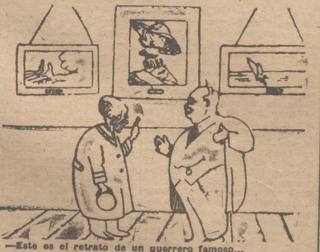
—Este es el retrato de un guerrero famoso... —No me diga más: el autor de "La Blanca doble".