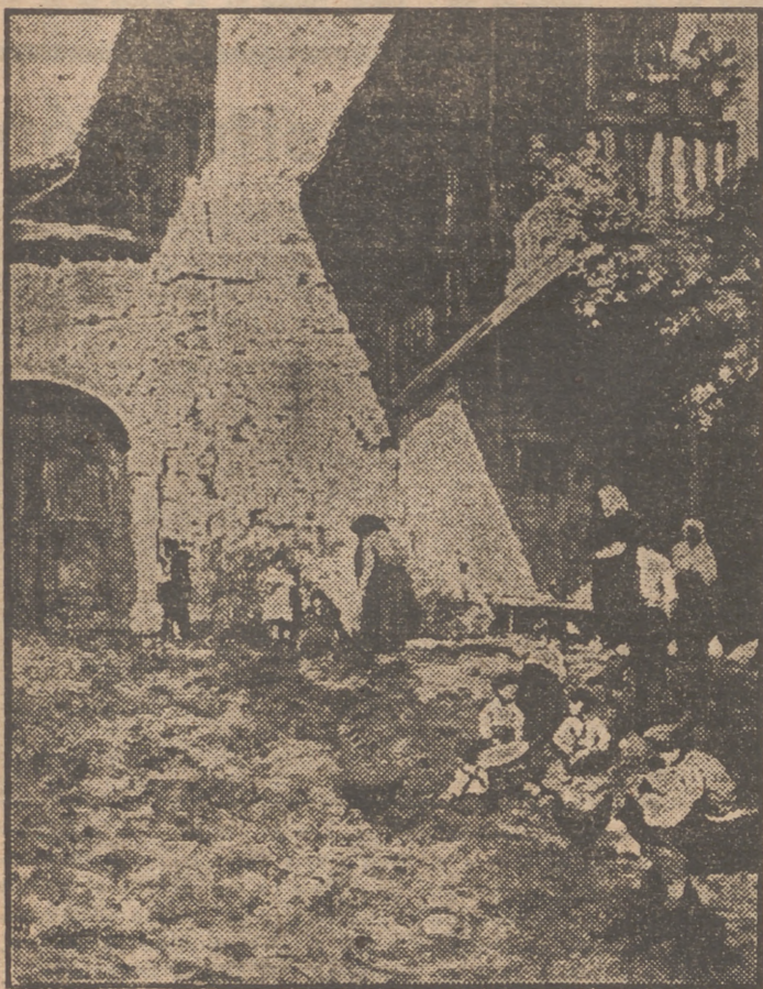
"Rincón almeriense", de Adelchi Garzotini.