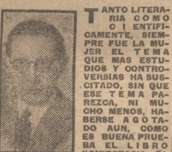
MUJER DE TREINTA AÑOS, DEL DOCTOR ANTONIO DE LA GRANDA.

El doctor Antonio de la Granda nos habla de esa edad femenina