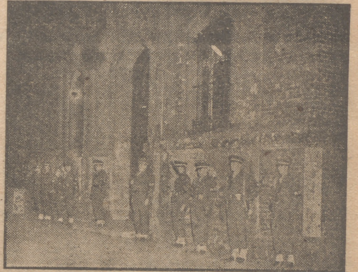
Policía armada norteamericana guarda la entrada de la Central Ferroviaria en el sector de Berlín que corresponde a la autoridad de los Estados Unidos. La Policía ha acordonado el edificio para impedir la entrada de tropas rusas. La tensión en Alemania ha seguido aumentando estos días, traduciéndose en incidentes que han dado en denominar "la guerra ferroviaria".