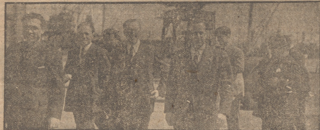
El Delegado Nacional de Sindicatos, en su reciente viaje a Asturias, visitó el Musel, puerto exterior de Gijón, primera arteria carbonífera de la Península y uno de los puertos más frecuentados por la navegación transatlántica, de cabotaje e intercontinental.