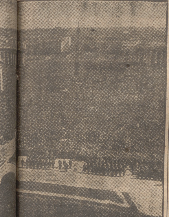
En el centro, la Basílica, se dirige a 400.000 fieles reunidos en el Domingo de Resurrección. Desde el mismo balcón ha sido obsequiada por el papa.