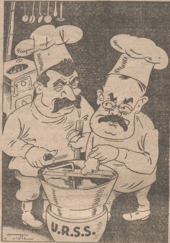
En la cocina del Kremlin se está cocinando el gran pastel ruso, con harina de todos los costales europeos. En la presente "ilustración" aparecen Stalin y Molotov entregados a sus faenas culinarias con verdadero regocijo ante la proximidad del banquete. El último ingrediente del pastel lo introduce Molotov en el molinillo que acciona Stalin sobre el fogón de la URSS: Checoslovaquia.

Más adelante hablaremos de Klement Gottwald, el hombre de Moscú en Checoslovaquia. Ahora sólo queremos apuntar que el actual jefe del Gobierno checo ya en 1936 en las primeras planas de los periódicos, respaldado casi siempre por monumentales retratos de Stalin y de Lenin. En ese mismo año,