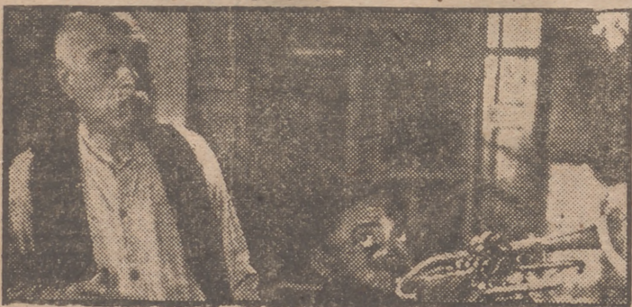
La crítica de Nueva York y Buenos Aires ha calificado el film "Vivir en paz" como la mejor producción de 1947. Reproducimos una escena de esta magnífica película que muy pronto se estrenará en Madrid.

Sometido el cine francés, por circunstancias múltiples y harto conocidas, a un momento de transición y de esfuerzo recuperativo, no sería quizá justo enjuiciarlo con el mismo criterio rigorista que a los de otros países que se desenvuelven en una órbita de mayor normalidad. En "La bella extranjera"—cuyo verdadero título creemos es "Martín de Romanic"—figuran todos los defectos de aquél sin que los pallen ninguno de sus antiguos aciertos. Hay una desmoralización... temática e incluso técnica. El asunto, harto crudo, deviene de un relato del escritor Pierre René Wolf y es la historia de una vampira, de uno de esos cefalopodos femeninos que tienden sobre el hombre seductores tentáculos de pasión