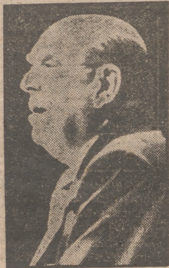
PRAGA, 10 (12,5 t.). — El ministro Jan Masaryk se ha suicidado, arrojándose por una ventana de su casa, a primera hora de hoy.

Un día u otro llegaría para él la cárcel, el proceso carnavalesco a que nos tienen acostumbrados los comunistas y, finalmente, la muerte. Prefirió suicidarse. Antes de arrojarse por una ventana vio la tumba de su padre, fundador de la República checa. Fué el adiós tranquilo y sin esperanza a una Checoslovaquia definitivamente muerta para los patriotas checos, de los que, como dijo Churchill de los polacos, pudiera decirse que no hubo virtud que no practicasen ni error que no cometiesen.