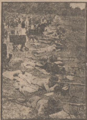
El campo de tiro de Bisley, escenario de la próxima Olimpiada de Londres.