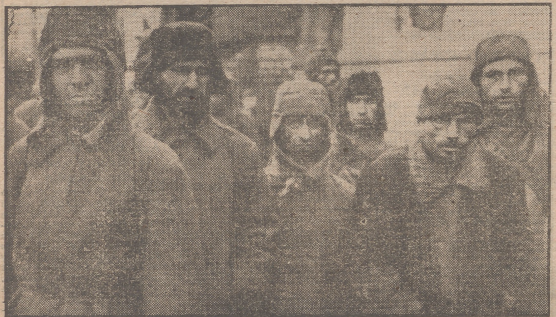
Un grupo de prisioneros rusos, esclavos del siglo XX, marcados con las huellas del hambre y del sufrimiento.

Impresionante relato a través de un libro escrito por dos autores rusos