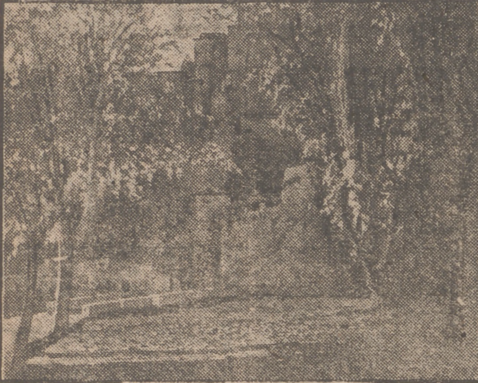
Un paisaje de Martínez Vázquez.