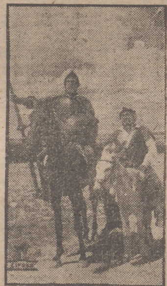
He aquí a Rafael Rivelles y Juan Calvo en una escena de "Don Quijote", formidable superproducción que para orgullo de nuestro cine ha producido Cifesa bajo la dirección del excelente director, Rafael Gil.