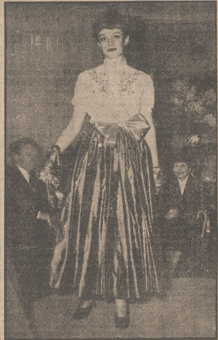
He aquí el traje "cocktail", diseñado por Pierre Balmain y que ha tenido un gran éxito en la exhibición de modelos del famoso modisto parisiense. La falda es de satén color gris, y la blusa, blanca, tiene bordadas unas lilas. Un cinturón con un gran lazo y los guantes, también de color lila, completan un conjunto encantador.