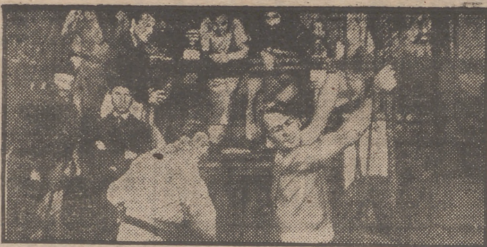
Reproducimos una de las más espectaculares escenas del formidable film "Revolución en alta mar". Es protagonista de esta verdadera superproducción de la Paramount Alan Ladd, el galán de la máxima popularidad. Para muy pronto, Mercurio Films anuncia el estreno en Madrid de "Revolución en alta mar".

Alan Ladd es el hijo—un poco dado a la mala vida—de un millonario que forma parte de una Compañía de Navegación norteamericana a la que pertenece un barco llamado "Peregrino", en el que la vida es un verdadero infierno. Alan Ladd embarca clandestinamente en el "Peregrino", y ante aquel espectáculo de los hombres cruelmente tratados, víctimas del hambre y de las enfermedades, reacciona y se regenera e incluso siente una gran pasión amorosa por la única mujer que va en el barco. Pero aún llega a más: él mismo organiza la revolución encaminada a salvar de la más negra esclavitud a los hombres del mar. La ac-