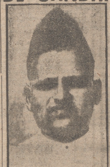
Este es Nathuram Vinayak Godse, de la alta casta de los brahmanes, de veinticinco años de edad, que asesinó a Gandhi en Nueva Delhi. Vinayak era editor de un periódico nacionalista, el "Hindu Rashtra", que combatía violentamente la política de tolerancia del mahatma.