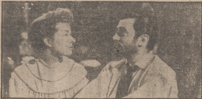
Greer Garson y Walter Pidgeon, los magníficos actores tan admirados de nuestro público, forman la pareja central del film de gran éxito "Madame Curie", que el próximo lunes se estrena en el Palacio de la Música.

encienden un pitillo. Ni que decir tiene que el varón arregla los feos asuntos de una villa, y en cuanto al amor femenino pudo haber sido punteado con más originalidad. Porque todo cuanto acontece tiene un monótono trasnochamiento y el interés queda enmohecido por el manidísimo de los episodios. Hay puñetazos y disparos a granel y un diálogo frondoso que resulta abrumador. Jack Conway no añade mediante la ejecución de la cinta ningún nuevo lauro a su crédito. Con los actores citados comparten el trabajo interpretativo Claire Trevor, Frank Morgan, Marjorie Main y Veda Ann Wood.— ARDILA.