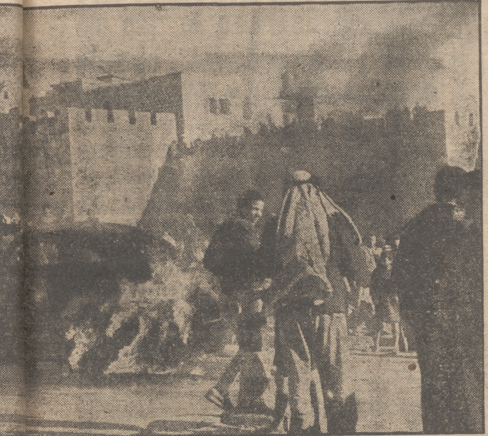
Una ciudad de Jerusalén arde de fondo a esta escena, una más en los continuos disturbios de Palestina que se incendia poco después de haber sido atacado por judíos un autobús árabe el 29 de diciembre.