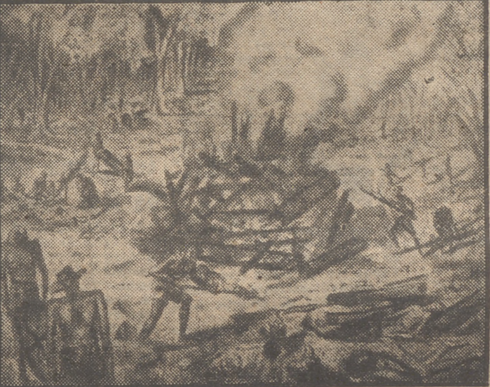
Este es uno de los cuadros pintados por Carlos Thrale cuando era prisionero de los japoneses en Birmania. Este cuadro, como todos los que realizó en el campo de concentración, fue pintado con brochas hechas con el propio cabello del artista. Los colores los obtenía Thrale destiñendo las cubiertas de viejos libros.