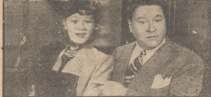
Joan Davis y Jack Oakie, principales intérpretes del jocoso film "¡Ay, qué lulú!", lo más divertido realizado hasta hoy por el cine americano. El lunes próximo será presentado por Cifesa en el cine Rialto.

demos augurar el éxito de "Vendaval", que lleva el sello de Juan de Orduña como productor. Una garantía más, pues Juan de Orduña es el hombre de la gran sensibilidad y de las exigencias, incluso para consigo mismo.