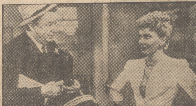
Jean Arthur y Charles Coburn en una escena de "Días impacientes", divertida cinecomedia que próximamente se estrenará en Madrid.