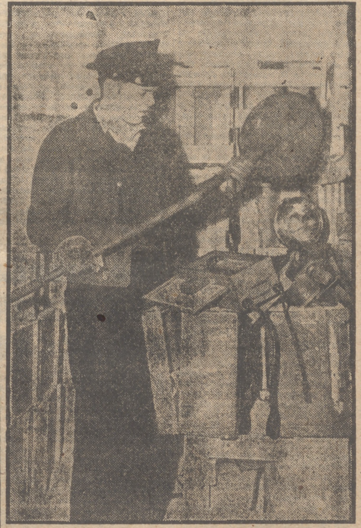
Un polifón examina un detector de minas, que formaba parte de un equipo militar encontrado en Nueva York embalado en cajas de maquinaria que se enviaban a Palestina con otras cantidades de explosivos camuflados.

la propuesta norteamericana y dijo que la cuestión del veto es asunto que requiere un profundo estudio de sus aspectos jurídico y político, lo que requeriría tiempo suficiente. (Efe.)