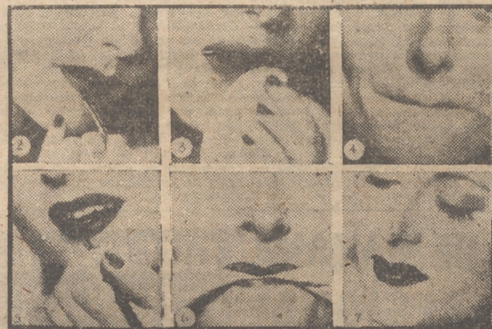
La cosmética moderna ofrece sus adelantos. He aquí distintas fases de esa operación en que la mujer retoca su boca para darle el máximo atractivo a fuerza de rouge y de... arte. (Foto A.)