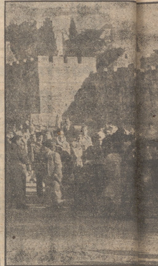
Parte del viejo muro de la antigua ciudad de Jerusalén. El taxi es judío y un grupo de imprenteros.

ATEO (10,30) después de una larga estancia en la ciudad milenaria donde se instaló el telégrafo que genera las transmisiones griegas de Vietnam, el grupo de irra, Jo aseguri correes Prensa la rebeldía nista será un futuro ministro guerra recibidosos a los palmas de menzo asiva e mes de Dijo, que los heros n bien ante y militan (Efe.)