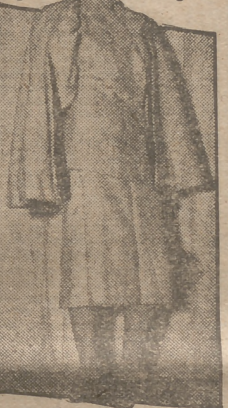
Este es el último modelo de vestido para mañana de principio de invierno. Falda larga, lana gris y media capa del mismo tejido. Completa el atuendo un alrogo sombrero

Sombrero de plumas negro y media capa de lana gris