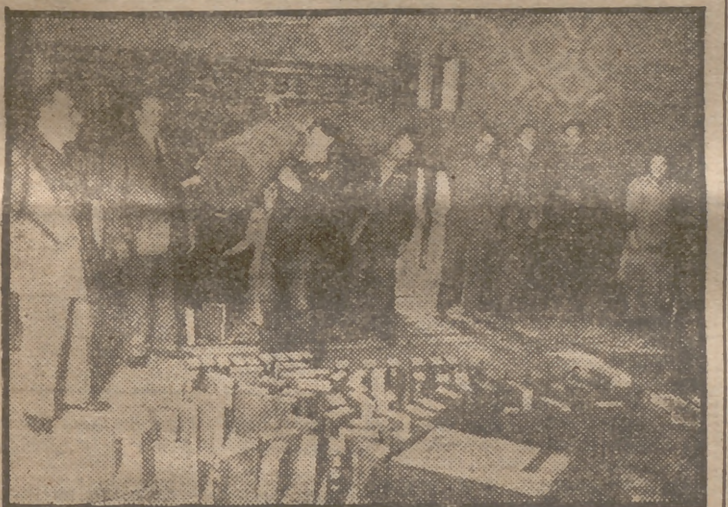
En el Ministerio de Hacienda se ha celebrado hoy el estado de sus dependencias, con el consiguiente asueto de los funcionarios, según costumbre tradicional.