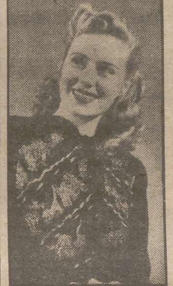
La Torre Eiffel, el Panteón y otros monumentos han sido escogidos para adorno de la blusa de crepé negro que lleva esta señorita. Ella es también un monumento o, por lo menos, merece que se la califique de escultural.