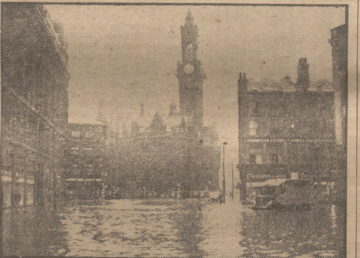
Mientras en el sur de Inglaterra se registran elevadas temperaturas, en el norte, persiste el frío y el mal tiempo, con temporales de agua y viento. La fotografía muestra una plaza inundada de una de las ciudades norteañas de Gran Bretaña.