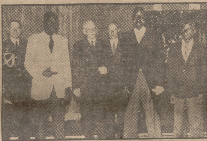
Don Pedro IV, Rey del Congo, visitó al Presidente Carmona, en Lisboa, el día 2 de junio. Le acompañaban su esposa, hijos y nietos. El viaje real tiene como meta Roma, para asistir a la canonización de Juan Brito, uno de los jesuitas primeros evangelizadores de la Guinea. En la foto, el Presidente Carmona a la derecha del Rey del Congo.