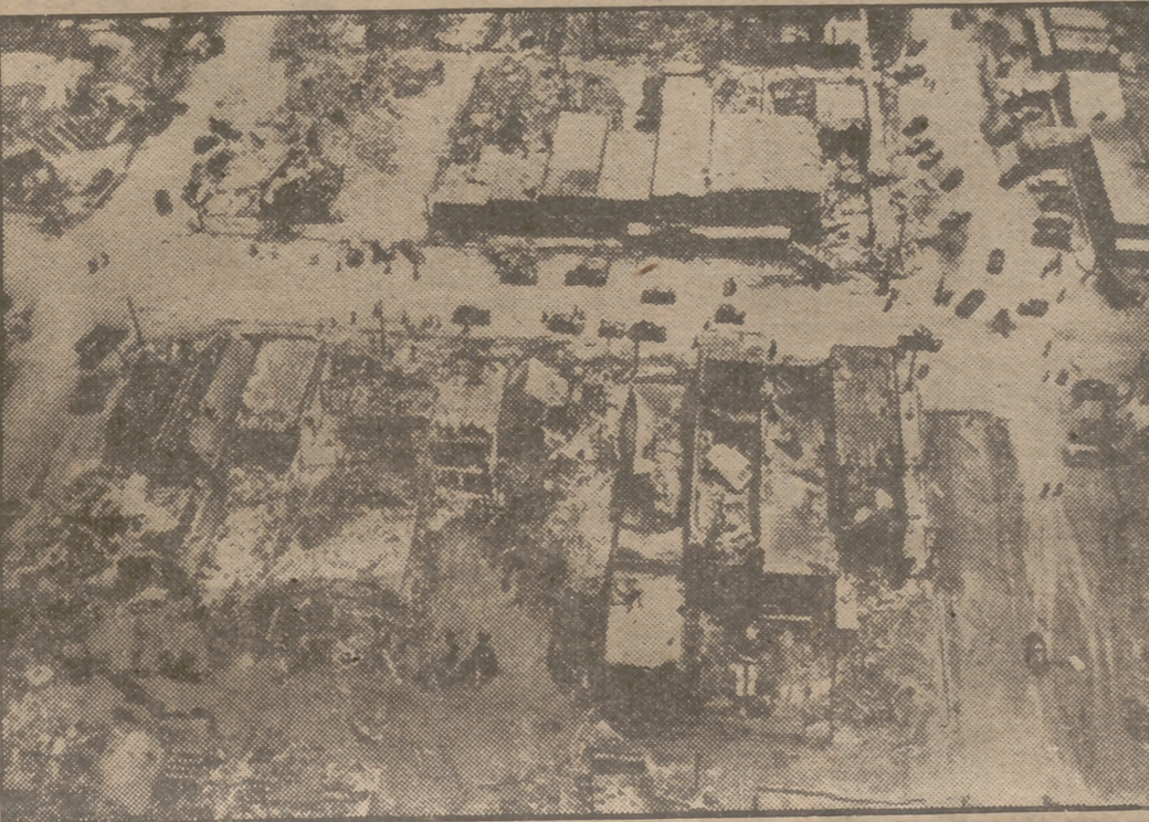
Vista aérea de los daños causados por el tornado en Leedy, de Oklahoma (Estados Unidos). Seis muertos y 25 heridos se registraron durante el gran temporal.