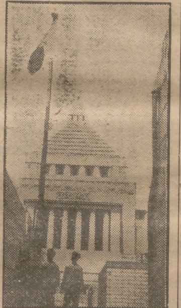
El 20 de mayo, por primera vez después de la derrota, volvió a ondear sobre la Dieta de Tokio la bandera del Sol Naciente, símbolo del Japón. Mac Arthur ha permitido sea izada en los edificios oficiales.