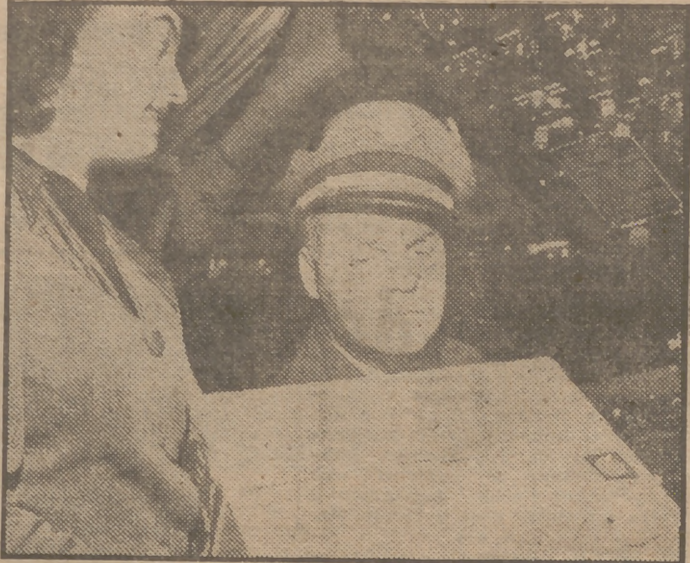
Esta caja, que con tanto cuidado entrega al piloto del avión la camarera de a bordo, contiene una inyección de suero, de no se sabe qué clase, de ocho libras de peso, con el que se va a intentar salvar la vida a la anciana madre del Presidente Truman, que se encuentra en gravísimo estado en su residencia de Kansas City. El medicamento fué transportado en avión, dada la urgencia del caso.