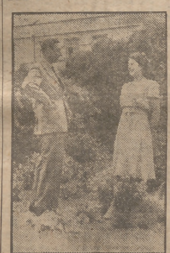
"La princesa Isabel es una muchacha sencilla y extraordinariamente bondadosa. Hela aquí en un momento de intimidad con su padre, Jorge VI." (De nuestro corresponsal.)