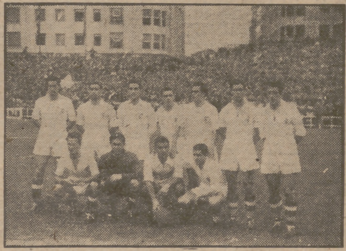
Equipo del Real Madrid vencedor en San Mamés ayer tarde del Atlético bilbaíno por un tanto a cero, pasando a finalista del campeonato de España.