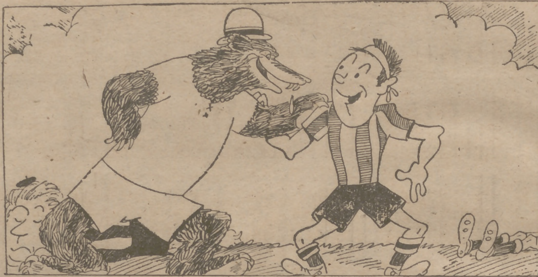
—Bien, amigo. Dentro de quince días, nos veremos.