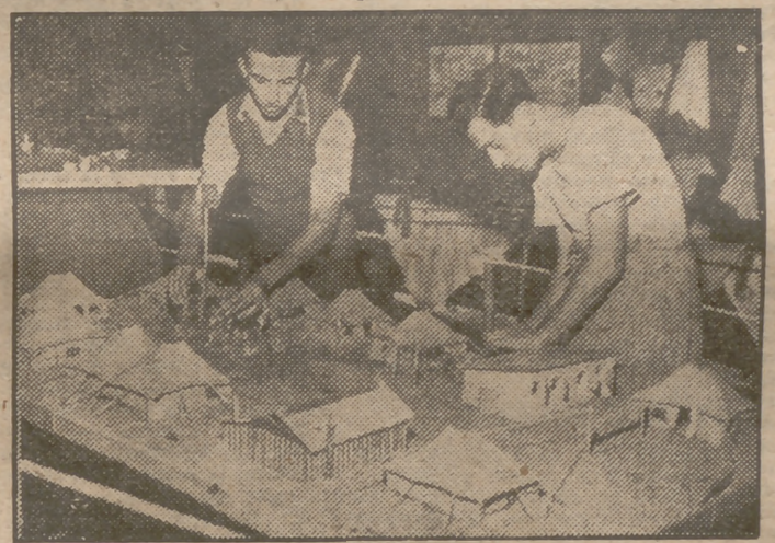
En el campo de concentración británico de casados instalado en Chipre, dos de los refugiados judíos entretienen su tiempo construyendo una maqueta del propio campo, con sus tiendas, dispositivos, etc., que exhiben a la admiración de los compañeros.