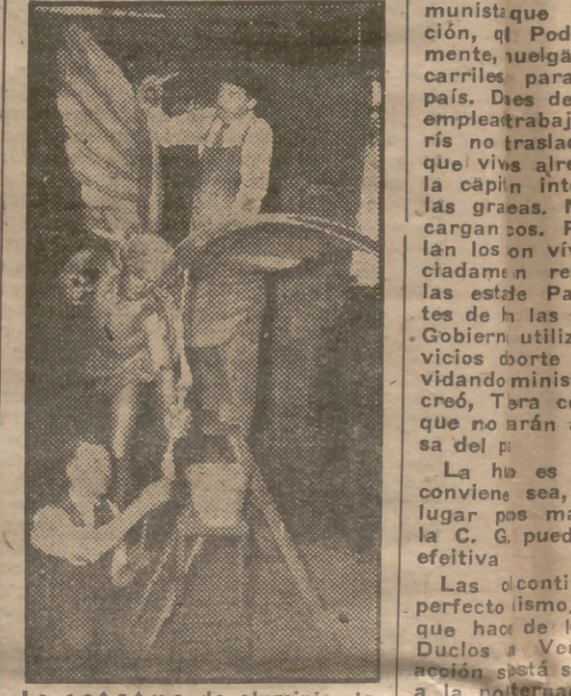
La estatua de aluminio de "Eros", creada por Alfai Gilbert y erigida en el Picadilly de Londres en junio de 1933, fué guardada durante la guerra para evitar los daños de los bombardeos aéreos. La estatua está siendo restaurada para volverla a su sitio.