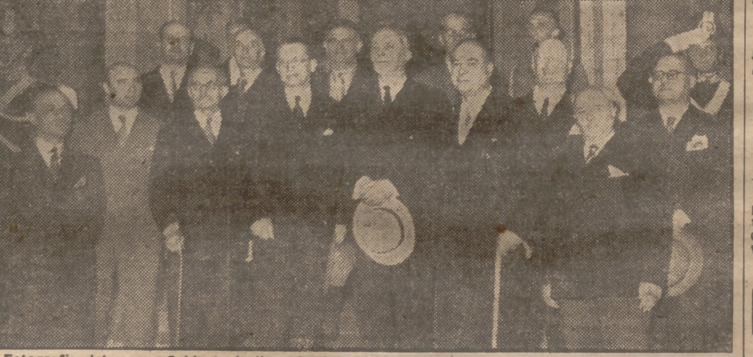
Fotografía del nuevo Gabinete italiano hecha en el palacio presidencial en Roma, Italia, después de su presentación al presidente Enrico de Nicola el día 1 de junio de 1947. De izquierda a derecha: Amintore Fanfani (Trabajo), Mario Scelba (Interior), Giuseppe Togni (Industria y Comercio), en segundo término; Luigi Einaudi, vicepresidente ministro de Hacienda; Antonio Segni (Agricultura), en segundo término; premier, Alcide de Gasperi; Guido Carbellini (Transportes), entre De Gasperi y Forza; Carlo Forza (Asuntos Exteriores), Umberto Merlin (Correos y Telégrafos), detrás de Grassi, con lentes; Giuseppe Grassi (Justicia); Paola Cappa (Marina Mercante), entre Grassi y Cingolani; Mario Cingolani (Defensa Nacional), y Guido Gonella (Instrucción Pública), sombrero en mano y con gafas. No han salido en la foto los siguientes ministros del nuevo Gabinete: Zio Vanoni (Finanzas); Umberto Tupin (Obras Públicas), y Cesare Mezagora (Comercio Exterior).