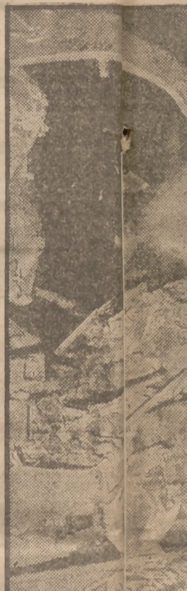
En la estación Liverpool otro detenido en vía. Mill quedó la locomotora, que pertenecía a la compañía que los viajeros, en ellos hubieron a su vez.