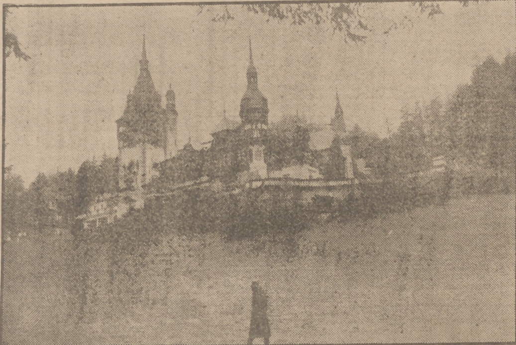
Esta es la regia mansión del Monarca de Rumania. El edificio tiene 160 habitaciones, y está situado en Sinaia, en los Cárpatos, a 150 kilómetros de Bucarest. Fué mandado construir en 1875 por el Rey Carol I, y lo proyectó el arquitecto Stöher. En 1914 fué ampliado.