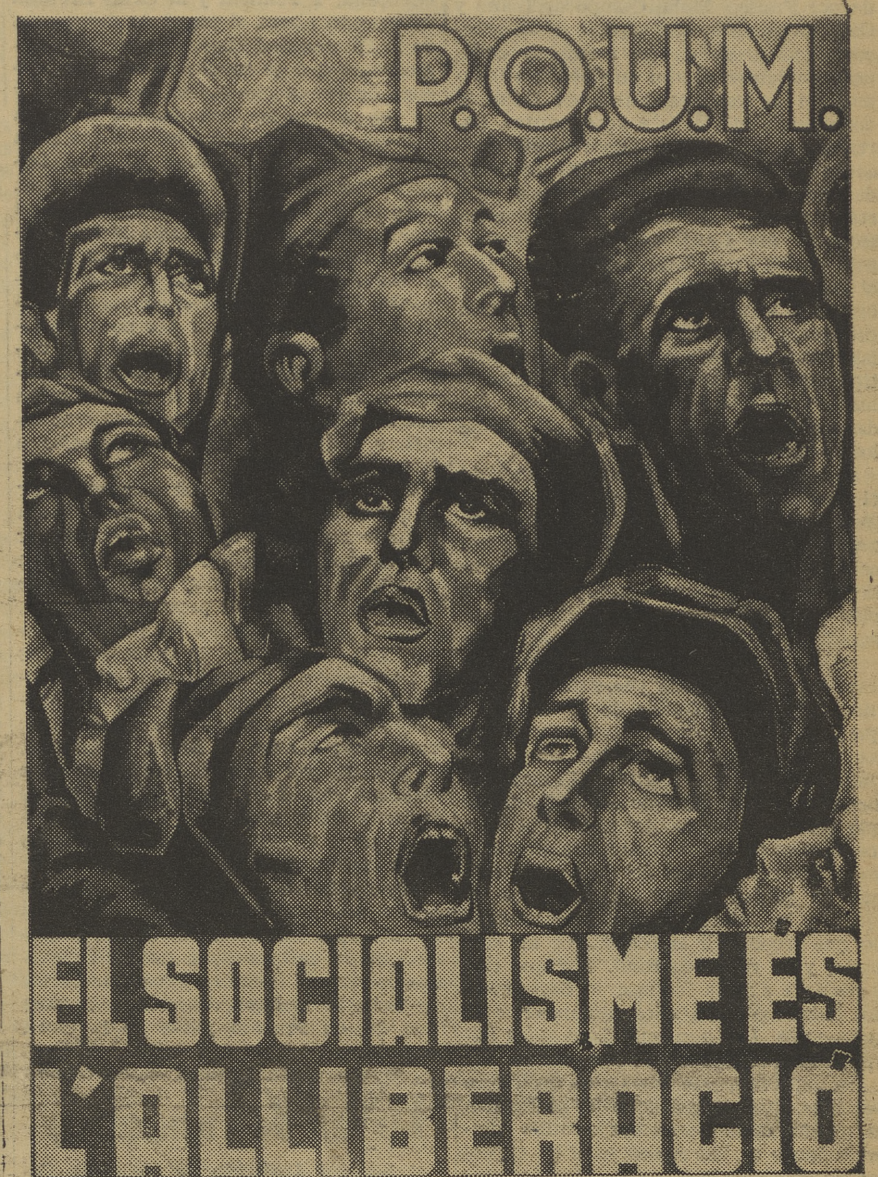
Un nuevo cartel editado por la Oficina Central de Propaganda del P. O. U. M., que nuestras Secciones deben apresurarse a propagar, haciendo los pedidos como para los otros

Los fascistas de retaguardia deben ser exterminados! Cobarde asesinato de un camarada de la J. C. I. en Gerona Los fascistas de retaguardia deben ser exterminados! Cobarde asesinato de un camarada de la J. C. I. en Gerona