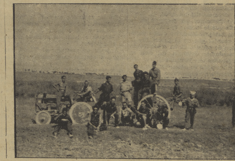
Piezas del siete y medio, de las que están bombardeando Huesca diariamente con gran eficacia