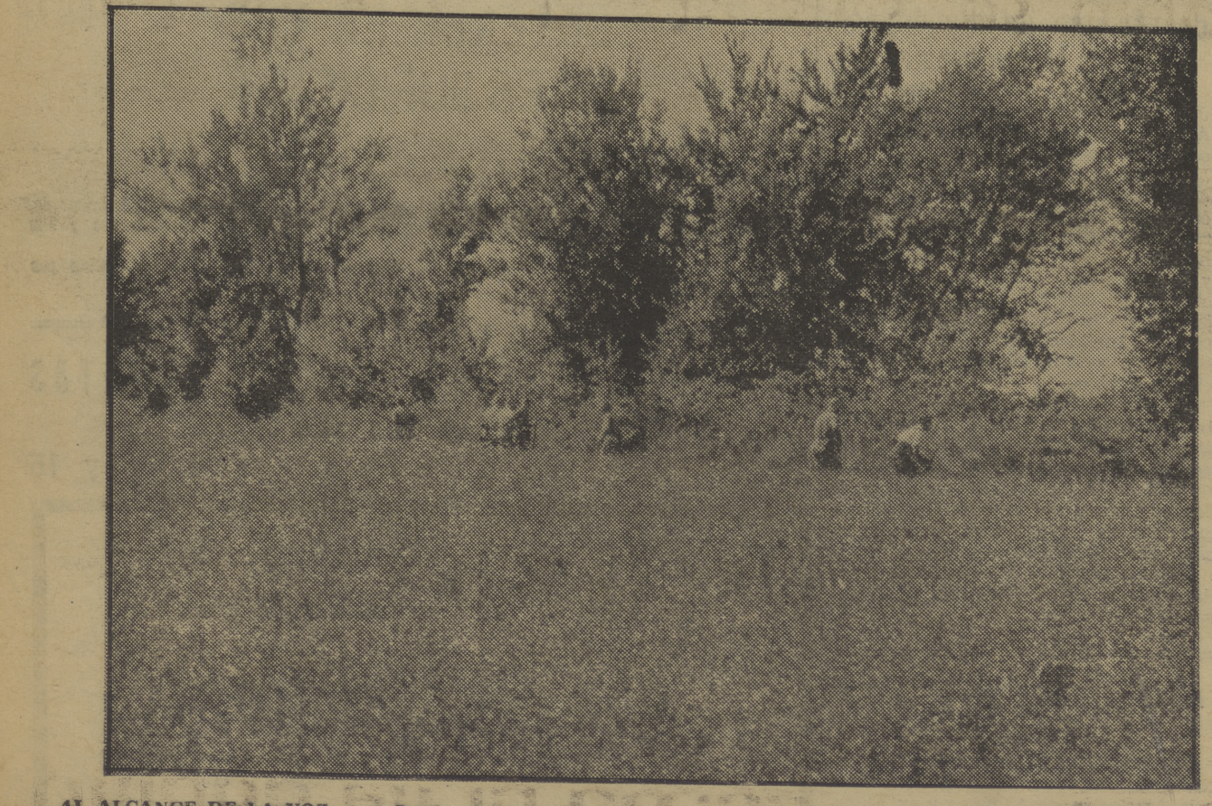
AL ALCANCE DE LA VOZ... Desde esta línea de fuego los milicianos vigilan al enemigo, parapetado al otro lado de las malezas...