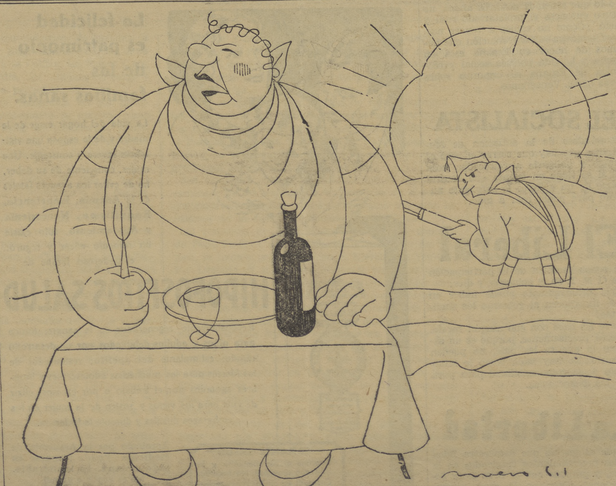
LA RETAGUARDIA. — ¡Garsón! ¡El fascismo...!