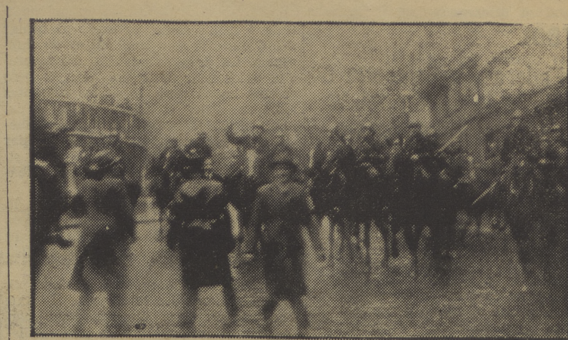
He aquí la primera foto llegada de la provocación fascista en Bruselas, que se estrelló contra la vigilancia obrera.