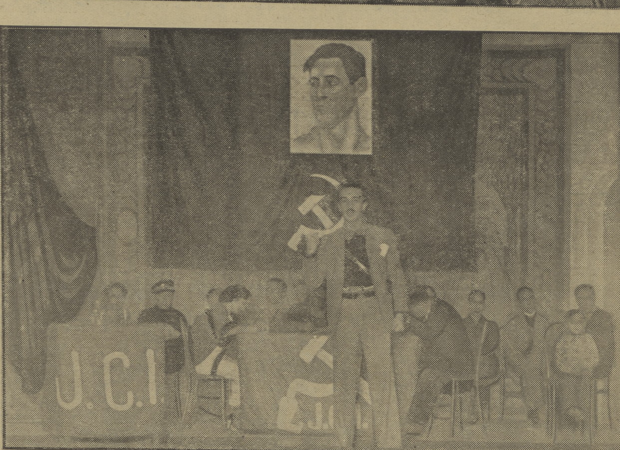
DEL MITIN DE LA J. C. I. EN MADRID. — Un aspecto parcial de la sala del Teatro María Isabel — uno de los más capaces de Madrid — totalmente lleno de trabajadores, y una foto del escenario. El magnífico acto de la J. C. I. fue prólogo de una intensa campaña de propaganda en todo el sector Centro.