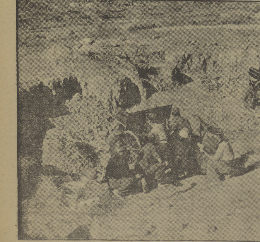
Nuestras patrullas batan con gran acierto las filas rebeldes, que intentan un asalto a la desesperada en el frente aragonés (Foto Centelles.)

El intenso ataque que llevan a cabo los fascistas en toda la línea Lecina-Alcubierre es contenido con eficacia y heroísmo por nuestros milicianos, de los que la foto nos presenta un grupo, parapetados tras un muro (Foto Centelles.)