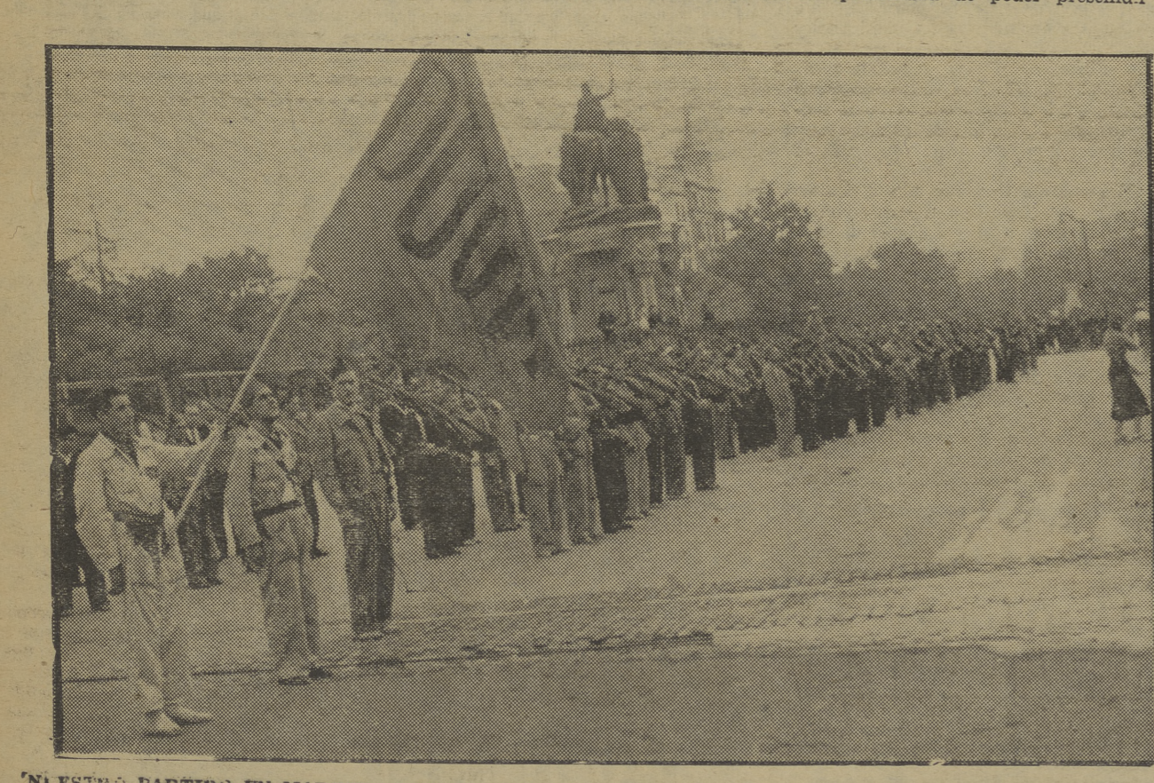
NUUESTRO PARTIDO EN MADRID. — El primer «Batallón Lenin» del P. O. U. M. de Madrid, pasando revista antes de salir para el frente.

Estas listas serán remitidas a los Presidentes de los Tribunales respectivos los cuales procederán al sorteo de los miembros. (Continúa en página 6.º)