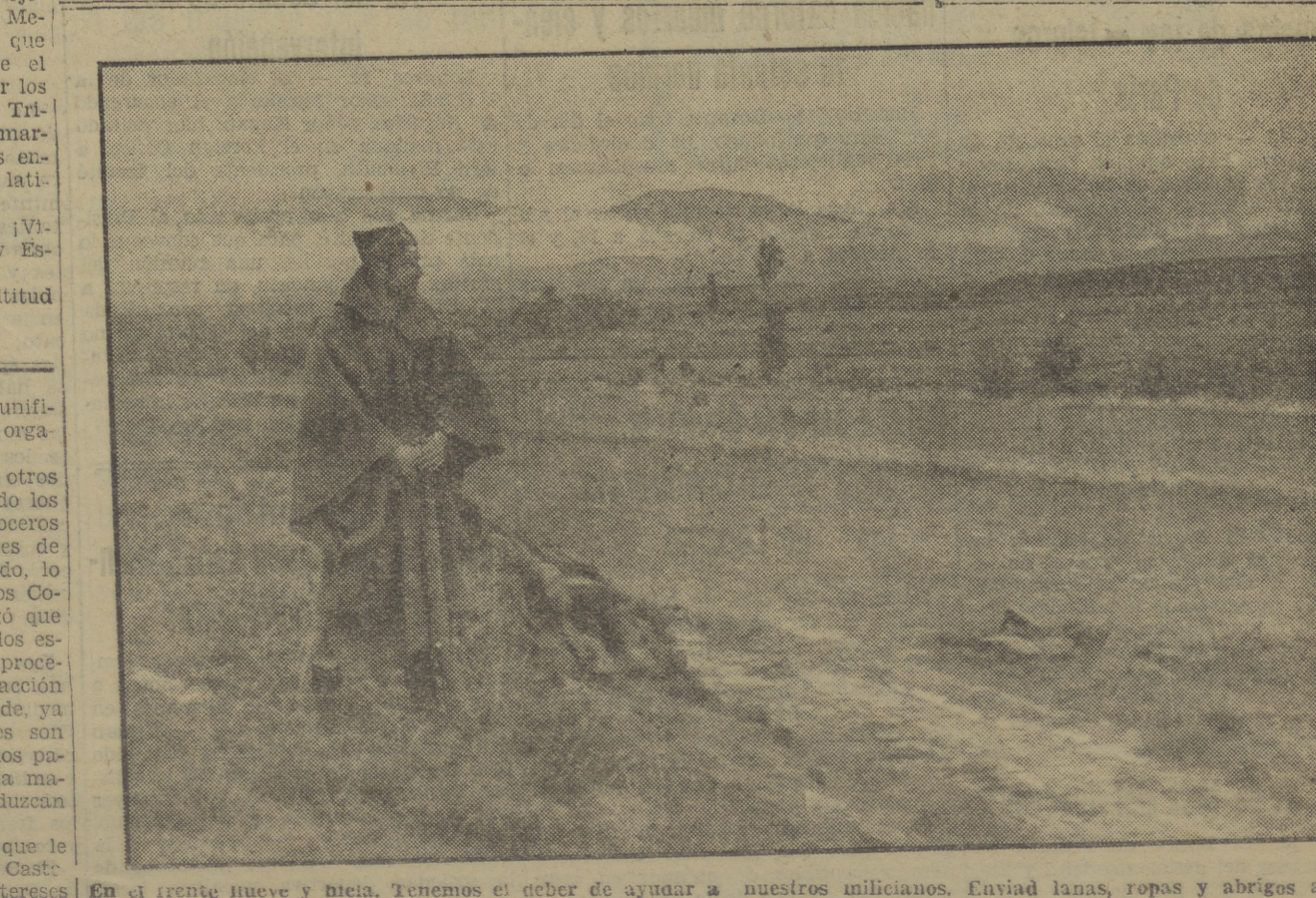
En el frente Pieve y Nieva. Tenemos el deber de ayudar a nuestros milicianos. Enviad lanas, ropas y abrigos al correo Rojo del P. O. U. M. (Pelayo, 62).

El meribundo bendijo a la multitud que presenciaba su muerte.