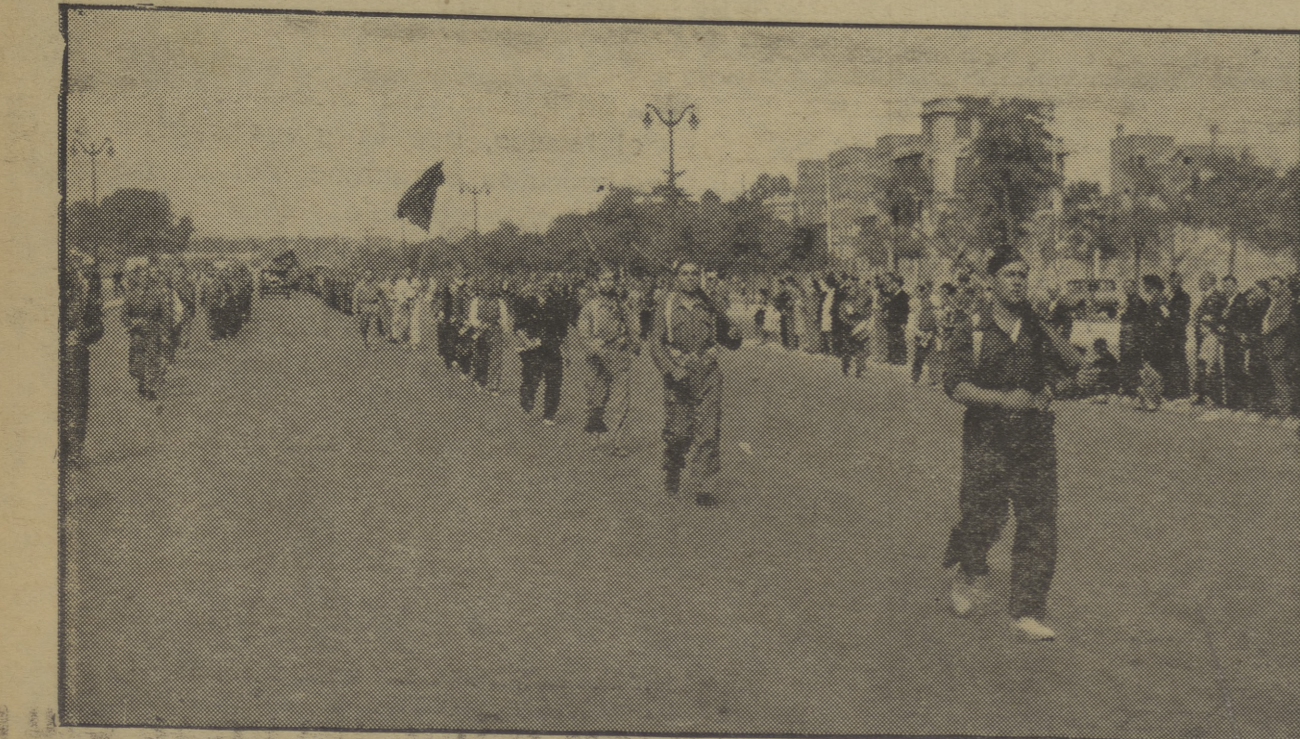
El «Batallón Lenin» del P. O. U. M., desfilando por las calles de Madrid antes de salir para el frente.