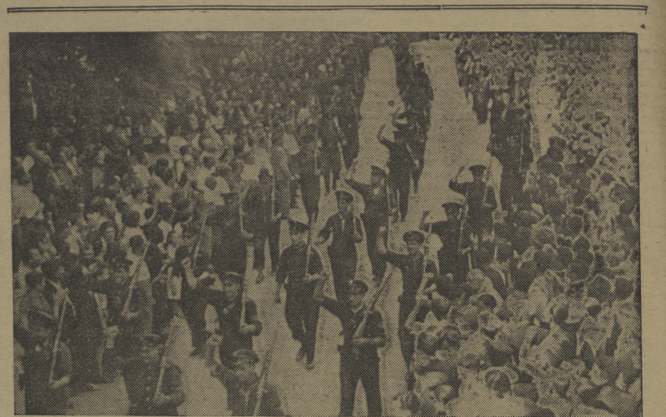
La guardia de Asalto de Valencia, desfilando por las calles de la ciudad del Turia, entre delirantes ovaciones, después de haber constituido sus Comités.