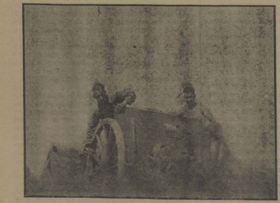
Un cañón de la batería del 75. del P. O. U. M., en Vicen, apunta hacia un reducito fascista

—Se padece mucha hambre en el campo fascista, nos dicen.