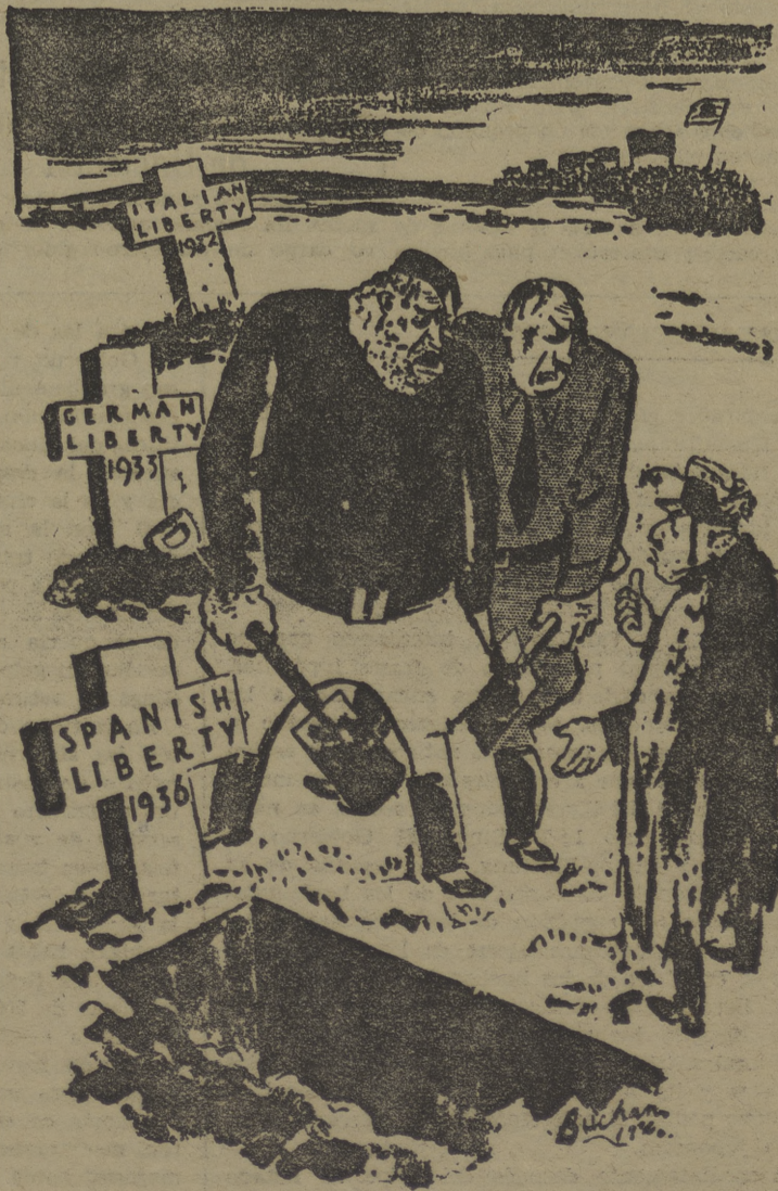
Reproducimos un grabado de una de las hojas de propaganda que por miles han sido repartidas por todo el territorio de Inglaterra, reclamando la solidaridad de los obreros ingleses. Literalmente traducido el pie de la caricatura, que representa a Mussolini, Hitler y su compinche el risible «General Franco», dice: «¿Cómo? ¿Pero es que todavía me has enterado a los trabajadores españoles...?»

A las dos se suspendió la vista, para continuarla por la tarde.