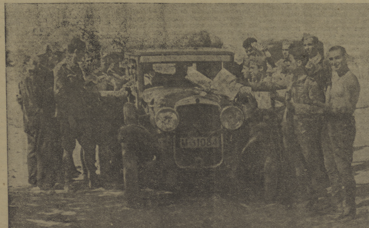
Una de las notas más pintorescas de los frentes de batalla, la constituye el reparto de prensa, ya que todos los milicianos rodean el automóvil de reparto, con el fin de no quedarse sin periódico que les da las noticias de las luchas de sus hermanos en otros frentes.

Madrid, 8.—Un corresponsal de «New York Herald Tribune» ha telegrafado a su periódico lo siguiente: «He estado en Pamplona. En los ojos de todos los jefes carlistas se lee la mayor desesperanza. Estuve hablando unos momentos con el ex secretario de la embajada española en Washington, que dimitió recientemente el puesto a causa de su monarquismo. Este diplomático se bate al lado de los facciosos. Me dijo: «Nuestro cuartel general nos ha ordenado, mañana, a las once, la toma de Irún, pero no tienen en cuenta el poder de las fortificaciones de los carlistas. El fuego de sus ametralladoras es terriblemente demoleedor y sus alambres más resistentes de lo que se imaginan.»