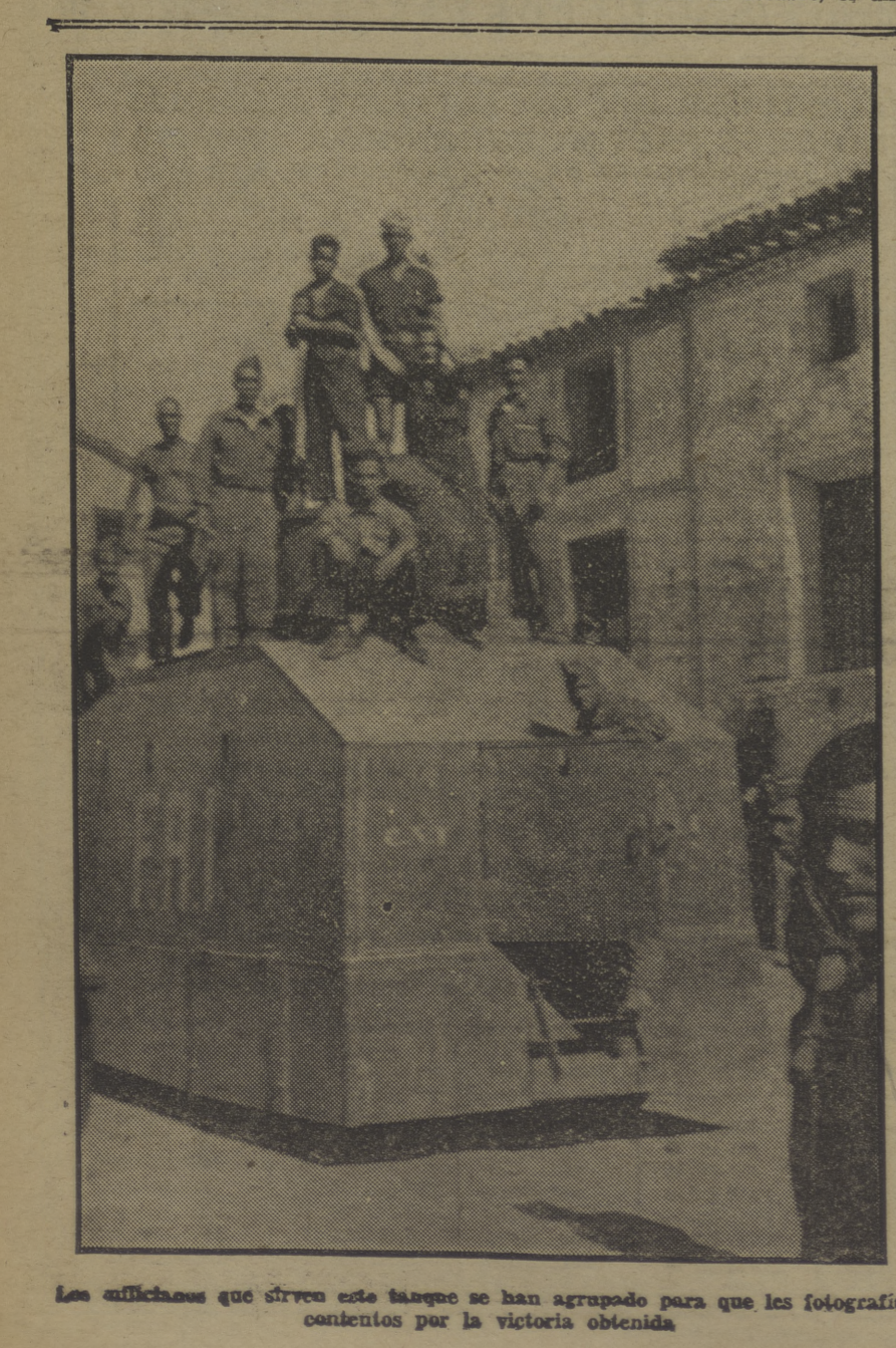
Los milicianos que sirven este tiempo se han agrupado para que les fotografien, contentos por la victoria obtenida.

36 mil libras esterlinas para material de guerra Para que puedan ser atendidas, de conformidad con la petición formulada por el Comité de Industrias de Guerra, diversas necesidades de carácter urgente, derivadas de las circunstancias actuales, A propuesta de los consejeros de Defensa y de Economía y Servicios públicos, inerin de Hacienda, y de acuerdo con el Consejo, Decreto: Artículo único.—La Secursal del Banco de España en Barcelona entregará a la Tesorería de la Generalidad la cantidad de 36.000 libras esterlinas oro, de la cuenta de dicho Banco.