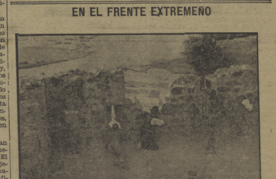
Estos mozos del pueblo de Medellin, durante el tiroteo contra los rebeldes, se parapetan bien detrás de las murallas del castillo, desde donde no dejan avanzar a los rebeldes ni un milímetro.