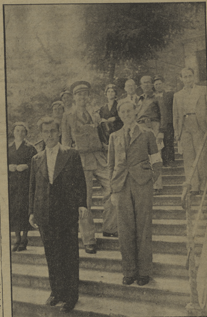
Ayer llegó a nuestra ciudad la primera expedición de la Cruz Roja de Londres, que viene a colaborar con nuestros sanitarios en la alta misión que tienen encomendada. Los obreros británicos hicieron un llamamiento para ayudar a la lucha española contra el fascismo, llamamiento que se vió atendido desde el primer momento. Los componentes de esta expedición se han puesto a las órdenes de los comités correspondientes, prestos al trabajo. He los aquí fotografiados al llegar a Port-Bou.