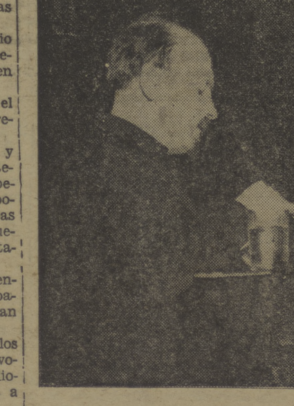
El camarada Bujanin, redactor jefe del diario «Izvestia», detenido, según parece, a causa de las declaraciones efectuadas durante el proceso Zinoviev-Kamenev en Moscú.