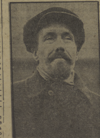
El camarada Rykoff, Comisario del Pueblo, que ha sido arrestado a consecuencia de las revelaciones hechas en el proceso Zinoviev-Kamenev.