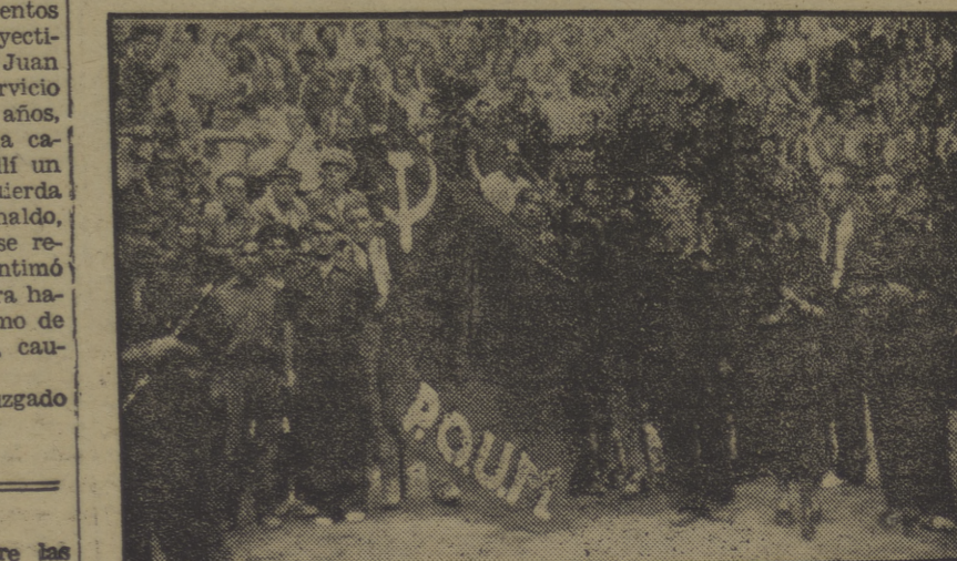
La representación del P. O. U. M. en un festival celebrado en la plaza de toros de Barcelona

Un periódico dice que el procedimiento que se seguirá contra Salazar Alonso será brevísimo.