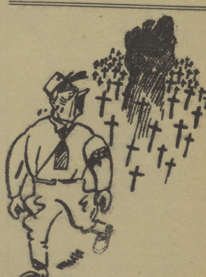
La perspectiva del infierno fascista. Tip. Cosmos.—Urgell, 42. Teléf. 32457.—Barcelona.

Lenin y los bolcheviques rusos convirtieron la guerra imperialista en guerra civil para así aplastar al ver-