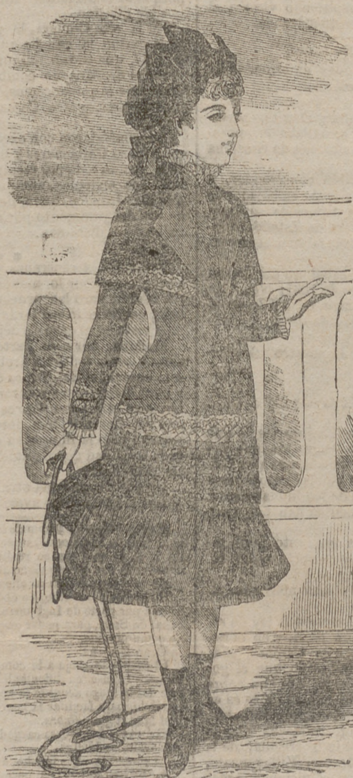
Trajes modelos para niños de todas las edades desde 5 pesetas.

doble ancho pura lana, valen 14 rs. á pts. 2 Mantillas y toquillas, imitacion, todo seda, valen 120 rs. . . á pts. 15 Satenes ricos, colores preciosos, ancho una vara, valen 16 reales. . . . . á pts. 1 Abrigos visita Kachmyr, con buenos adornos, valen 8 duros. . . . . á 2 Modelos últimos de París con ricas pasamanerías, valen 12 duros. . . . . á 6 Nuevo modelo del Abrigo Parisien de rica tela de seda otomana, vale 16 duros. . . . . á 8 Chaquetillas preciosas para señoritas, modelos últimos, valen 10 duros. . . . . á 4 Trajes para niños, adornados con puntillas, para 1, 2, 3 y 4 años, valen 3 duros. . . . . á 11/2