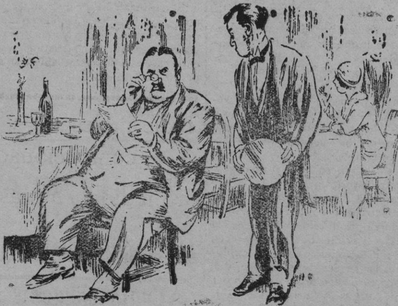
Pensaba desherrar a mi hijo pero después de esta cuenta es innecesario.

Id. Denuncia por defraudación del arbitrio sobre Carnes.