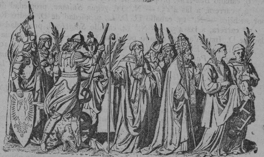
Los Mártires.—San Esteban, San Lorenzo, San Anacleto, San Juan Nepomuceno, San Martín, San Blas, San Sebastián, San Jorge, San Canuto rey y mártir, San Victoriano.