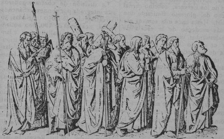
Los Apóstoles.—San Pedro, San Pablo, San Judas Tadeo, San Juan, San Simeón, Santiago el Mayor, Santiago el Menor, San Felipe, San Andrés, San Bartolomé, San Mateo, Santo Tomás, San Matías.

No es la realeza de Cristo una mera superioridad de talento, de verdad, de santidad, de bondad que se gana las al-