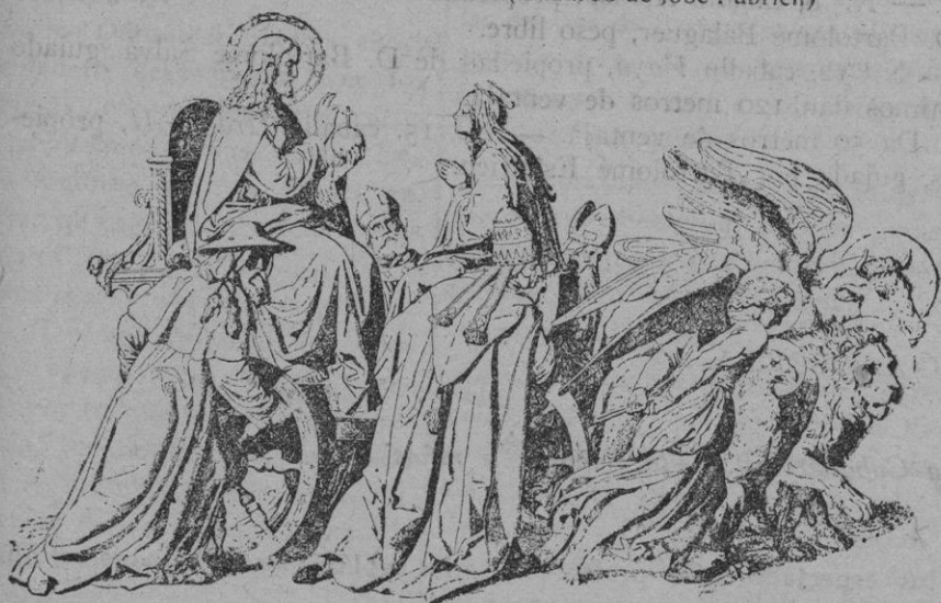
Triunfo de Cristo Rey.—San Juan Evangelista (águila), San Mateo (ángel hombre), San Marcos (toro), San Lucas (león). Carroza real: Jesús y María: Cuatro Doctos de la Iglesia.