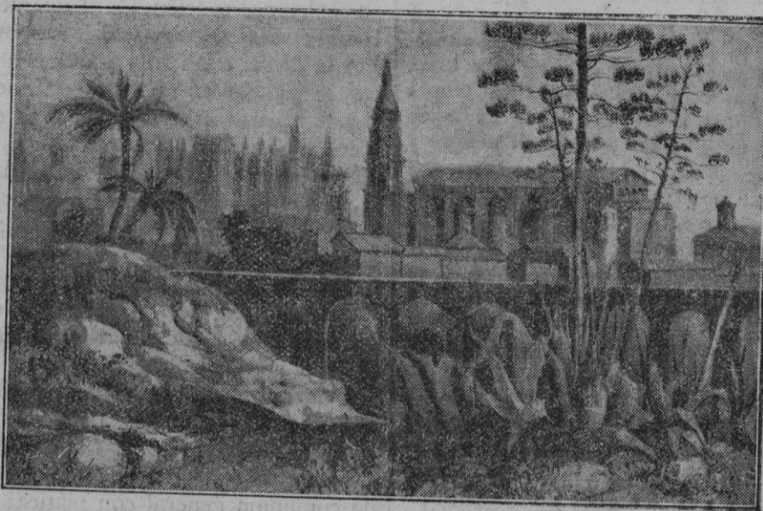
Del libro Souvenirs d'un voyage d'art a l'île de Majorque , por J. B. Laurens (1840). Vista de Palma tomada desde la muralla, cerca de la iglesia de la Misericordia.

Conviene, antes de pasar a otro punto, esclarecer un concepto que ha sido olvidado, injustamente en mi sentir, por cuantos han tratado de «La Campana de la Almudaina», incluyendo al mismo Guillermo Forteza. Me refiero al ambiente local, a la fisonomía inconfundiblemente mallorquina del hermoso drama. Acaso los espíritus formularios, que sólo reparan en lo expreso y jamás en lo substancial y latente, han considerado a Palou desligado de toda influencia particularista, y puede que acierten si se limitan a negar el propósito deliberado de seguirla. Mas, por ligero que sea el examen, por somera que resulte la atención prestada a sus escenas, dejando a una parte el vigor dramático, el espectador mallorquín se halla en la plena atmósfera de su tierra, aspira el aroma de sus jardines, siéntese arrullado por el aire de sus ruinas y percibe el eco que retornan sus monumentos.