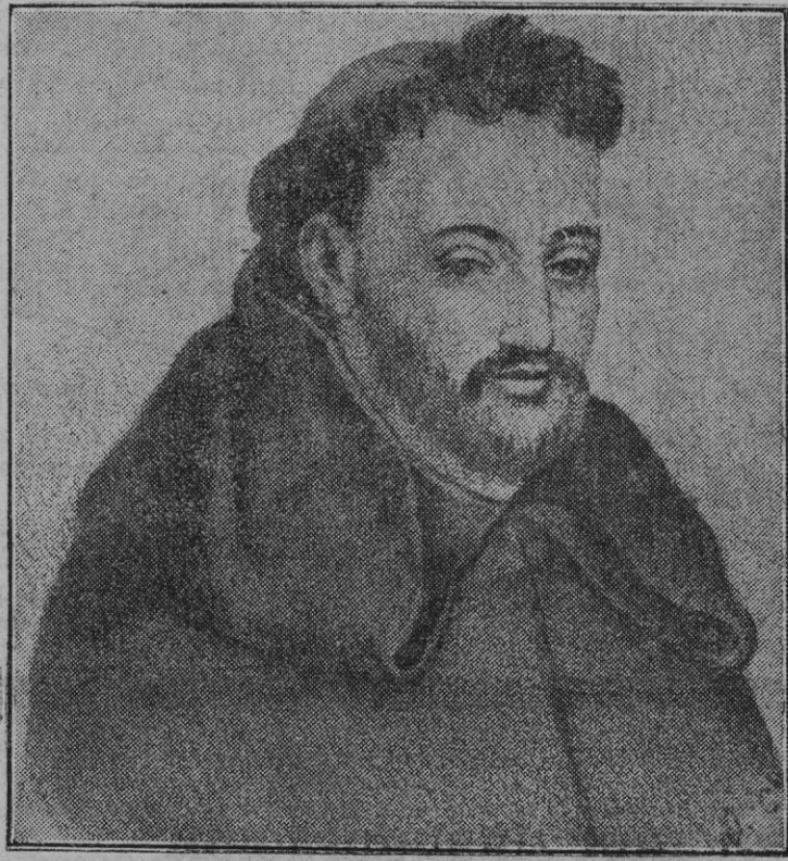
Retrato de Fray Luis de León, que publicamos con motivo del cuarto centenario del nacimiento del inmortal poeta.