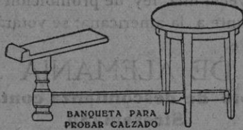
BANQUETA PARA PROBAR CALZADO

FÁBRICA Y DESPACHO: Calle Gabriel Maura y San Campos (San Suñer) TELÉFONO 16