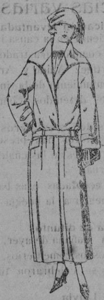
Abrigo gabardina inglesa, impermeabilizada, en negro, azul y color de ptas. 70 a 165