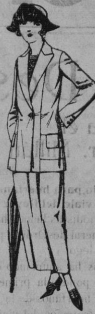
Trejes sastre, de carga inglesa, satén, estambre, etc. chaqueta forrada de seda, en negro, marino y colores moda de ptas. 115 a 150