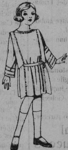
Vestidos de serga inglesa, popeline, etc. en azul y color, adornos pespunte seda para niñas de 4 a 9 años de ptas. 35 a 42