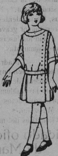
Vestidos de crepé de lana, es-tambre, etc. en azul y color, para niñas de 4 a 9 años de ptas. 30 a 40