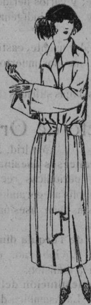
Paletots de punto de seda, en negro, azul y color de ptas. 50 a 130