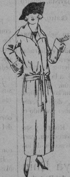
Guardapolvos de dril, satén, etc. colores moda de ptas. 29 a 50