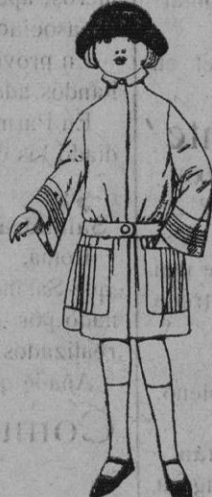
Abrigos de terciopelo de lana, gabardina, etc. en azul y color, para niñas de 4 a 12 años de Ptas. 30 a 50