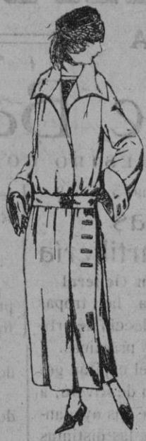
Abrigos de gamuza, gabardina, etc. en negro, azul y color de ptas. 70 a 100