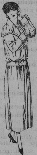
Guardapolvos de dril crudo gris, etc. de ptas. 25 a 40