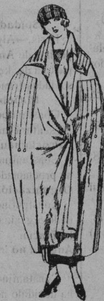
Capas de gabardina, pañete, etc. diferentes colores de ptas. 85 a 125