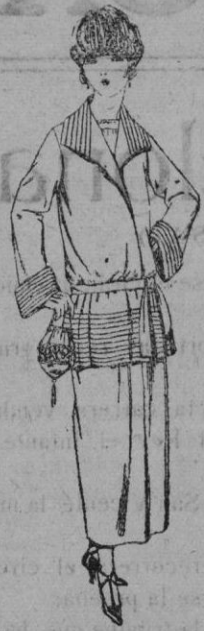
Trejes sastre de seda, inglesa, chaviot, etc. Adorno pliegues, chaqueta, forrada de seda, en negro, azul y color de ptas. 137 a 165

Madrid, Barcelona, Alicante, Almería, Bilbao, Cádiz, Cartagena, Gijón, Granada, Málaga, Santander, Sevilla, Valencia, Valladolid, Zaragoza