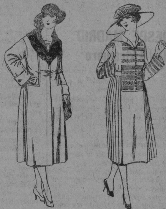
Abrigos de gamuza, pañete, en negro, azul y color, adornos terciopelo negro de ptas. 120 a 150