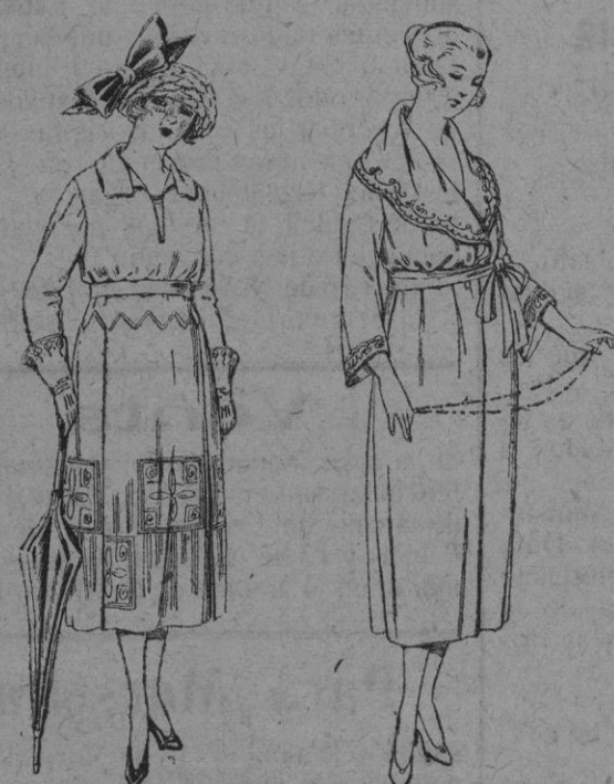
Vestidos de sarga inglesa, lanilla, estambre, etc. en negro, azul y color, adornos bordados de ptas. 115 a 150