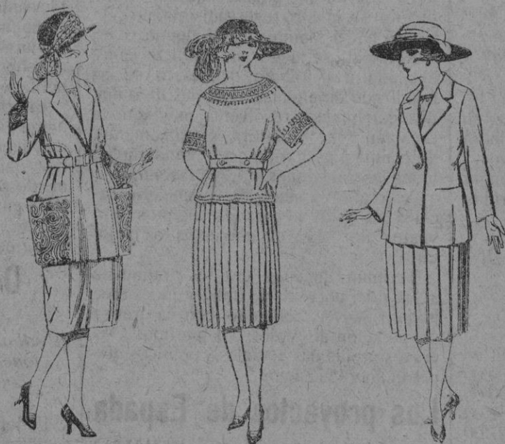
Trajes de gabardina, lanilla, sarga inglesa, etc. en azul y color, adornos bordados de ptas. 100 a 130