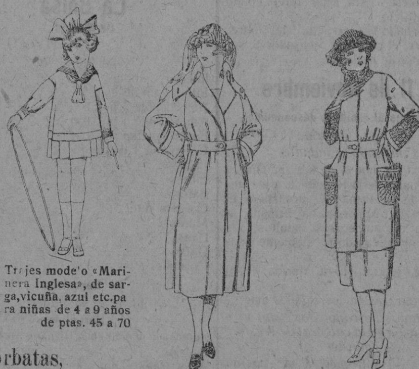
Trajes modelo «Marinera Inglesa», de sarga, vicuña, azul etc. para niñas de 4 a 9 años de ptas. 45 a 70

Precio fijo—Pídase el catálogo general—Ventas al contado