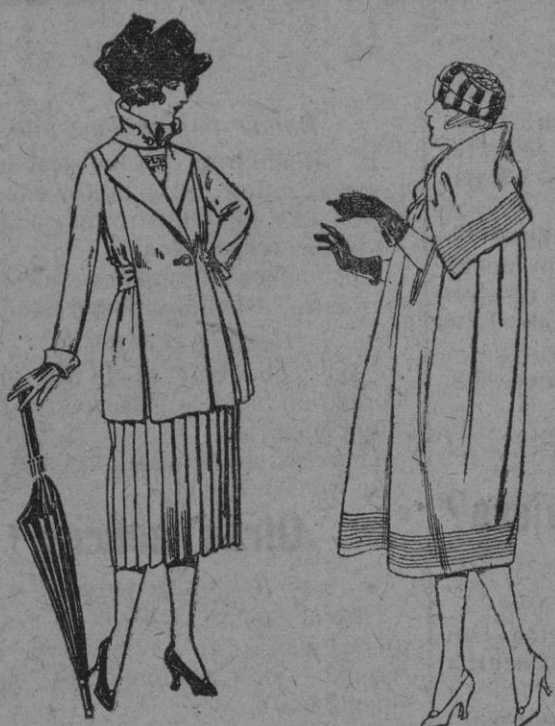
Trajes de gabardina, lanilla, estambre, etc. en negro y azul y color de ptas. 130 a 165

Madrid, Barcelona, Alicante, Almería, Bilbao, Cádiz, Cartagena, Gijón, Granada, Málaga, Santander, Sevilla, Valencia, Valladolid, Zaragoza