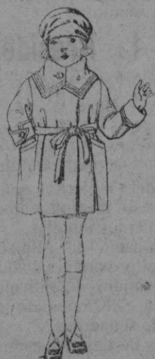
Abrigos de terciopelo, en azul y color, para niñas de 4 a 9 años de ptas. 50 a 65