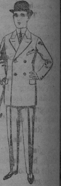
Trajes de patén, vicuña, etc. para niños de 10 a 12 años. De pts. 23 a 50. Los mismos para jóvenes de 13 a 16 años. De pts. 25 a 53