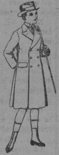
Gabanes de patén, para niños de 4 a 9 años. De pts. 16 a 50