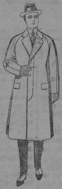
Gabanes de patén, melton o cheviot con forro de seda, satén o escocés. De pts. 50 a 100

Madrid, Barcelona, Alicante, Almería, Bilbao, Cádiz, Cartagena, Gijón, Granada, Málaga, Santander, Sevilla, Valencia, Valladolid y Zaragoza