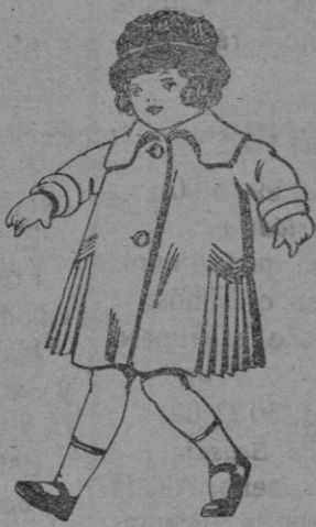
Abrigos de pañete, gamuzas, etc., para niñas de 4 a 9 años. De pts. 24 a 36