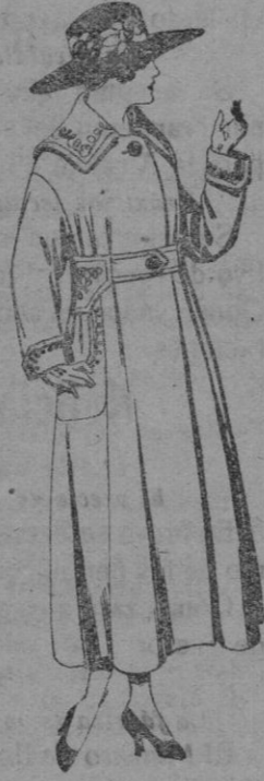
Abrigos de gabardinas, pañete, etc., en azul y color bordados. De ps. 75 a 95