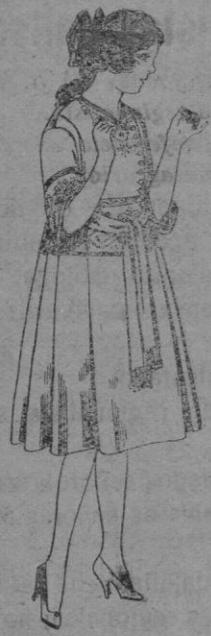
Vestidos de sarga inglesa azul, bordados, para jovencitas de 12 a 15 años. De pts. 42 a 46

Precio fijo-Ventas al contado PÍDASE EL CATÁLOGO GENERAL