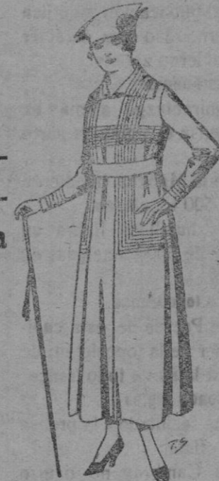
Vestidos de gabardinas, oxford, en negro, azul y color, bordados. De pts. 60 a 85