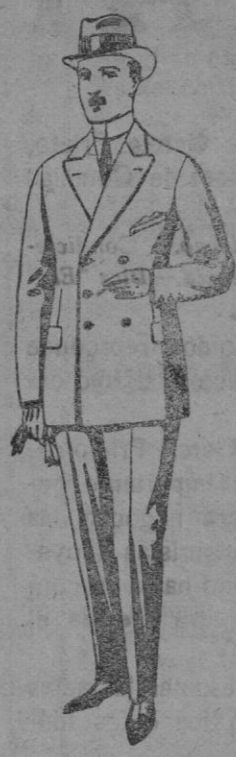
Trajes de cheviot, melton etc. De pts. 28 a 85. Los mismos en vicuña o jerga De pts. 32 a 90