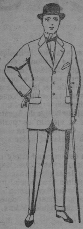
Trajes de cheviot, melton, etc. De pts. 25 a 85. Los mismos en vicuña o jerga De pts. 30 a 90