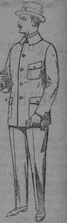
Guerreras de dril crudo, kaki o blanco De pts. 7-50 a 10