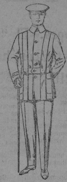
Cazadoras de dril crudo o kaki De pts. 12 a 18