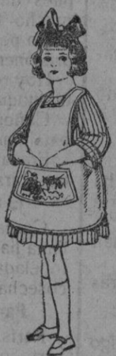
Delantal de dril color beige De pts. 3 a 7