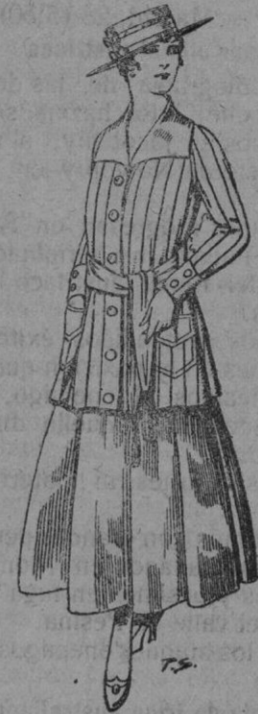
Paletot de tricot de seda colores lisos a pts. 39