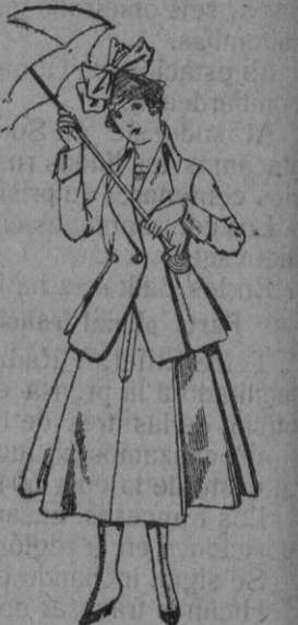
Trajes de lanilla negro, azul y color para juveniles de 13 a 18 años De pts. 50 a 55