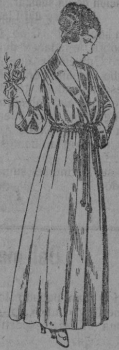
Bata crepon, colores varios, cuello y bocanarga ecda. De pts. 15 a 20