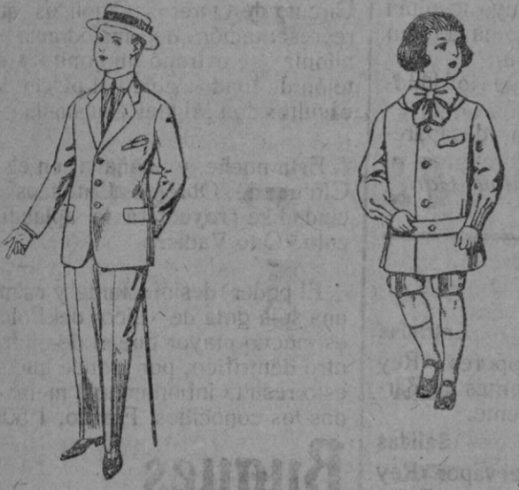
Trajes de lanilla vicuña etc. para juveniles de 10 a 16 años De pts. 14 a 48 Trajes de lanilla colores para niños de 4 a 9 años De pts. 9 a 18