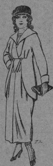
Trajes de jerga negra o azul para jovencitas de 13 a 16 años De pts. 30 a 35