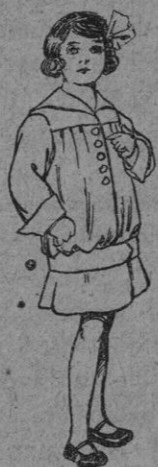
Vestidos de lana para niños de 4 a 9 años De pts 16 a 25

Precio Fijo Ventas al contado Pídense el catálogo general