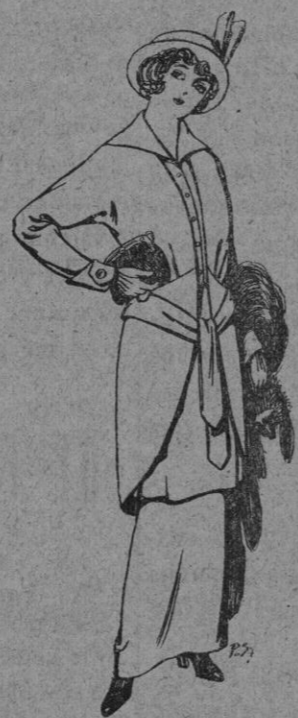
Trajes de jerga negra y azul para Señora De pts. 85

Ropas confeccionadas para Caballero Señora, niño y niña