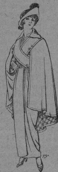
Capas de lana negra para Señora Ptas. 16

ÚLTIMAS NOVEDADES EN PELETERIA Gorras, Sombreros, Cinturones, Calcetines, Corbatas, Fajas, Ligas, Tirantes, etc., etc.