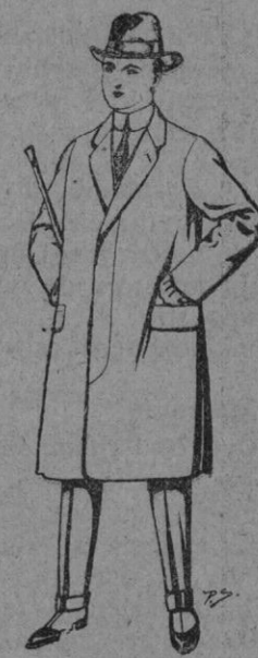
Gabanes de lana para niños de 10 a 16 años De pts. 20 a 45