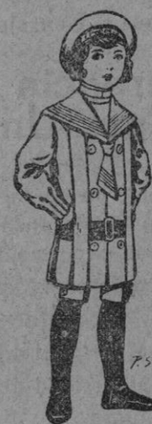
Trajes de jerga negra para niños de 4 a 9 años De pts. 20 a 22

Precio Fijo Ventas al contado Pídense el catálogo general