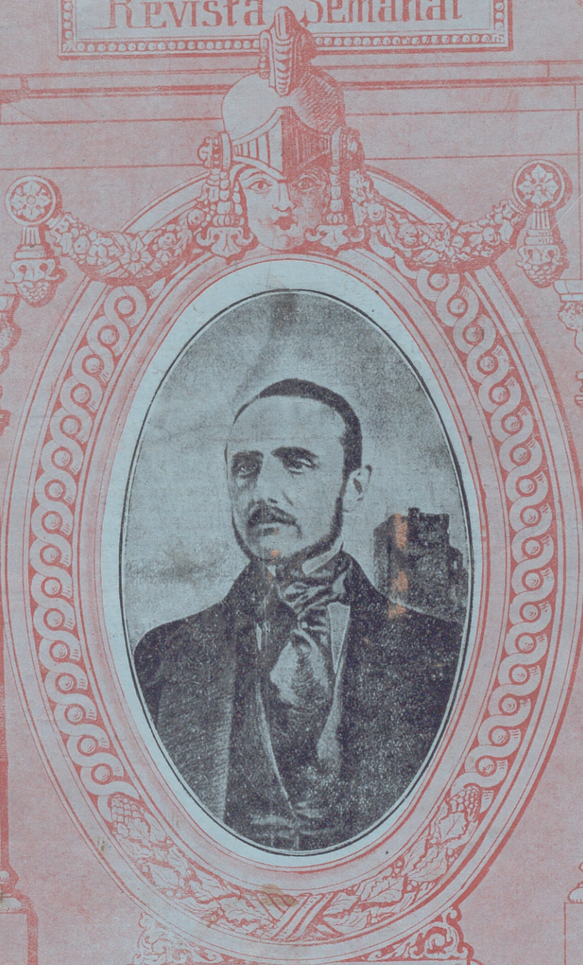
D. Enrique Gil y Carrasco