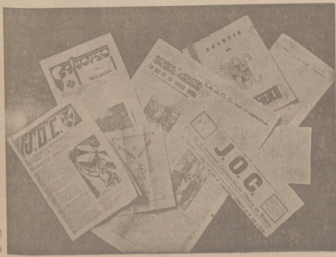
Prensa jocista española