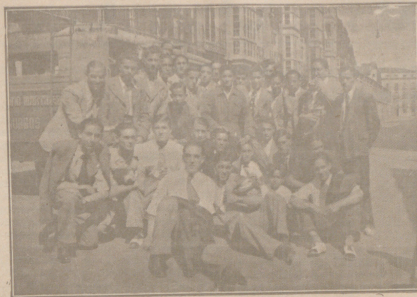
Desplazamiento del equipo «Juventud F. C.» a Brivesca