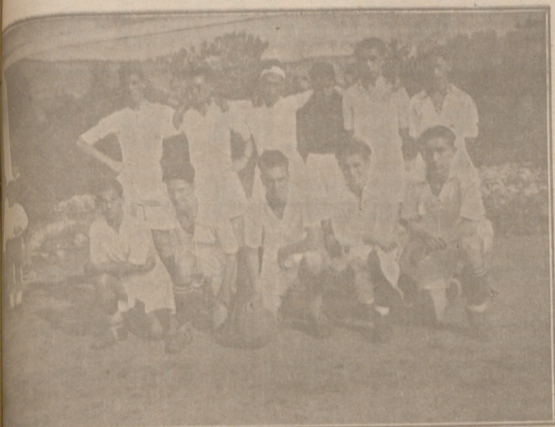
El primer equipo «Juventud F. C.»